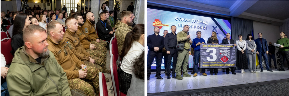
За власні та партнерські кошти та стратегічного партнерства з Благодійним Фондом МХП-Громаді ГО "Ми – Вінничани" придбали на 3 млн грн техніку і спецобладнання – автівки та запчастини до них, розвідувальні та ударні дрони, тепловізори, засоби РЕБ та радіостанції, комп'ютерну техніку та супутникові модеми.