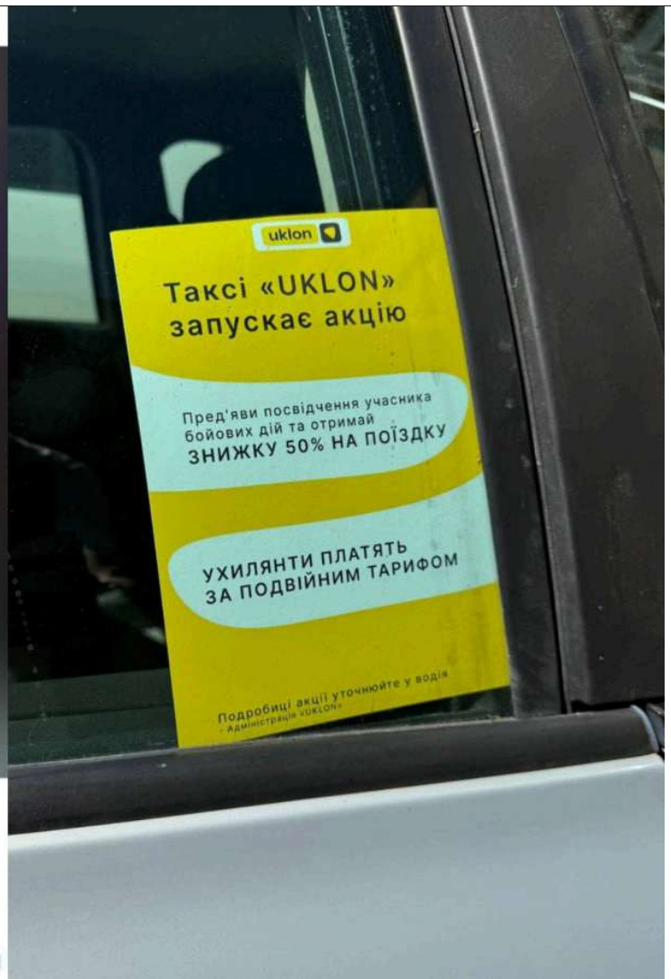
Типичное такси в Одессе. Бесплатный проезд для ВСУшников, а двойной тариф — для уклонистов (если не сможете предъявить удостоверение)

1541 849 311 120 117 66 52 20 14 8 6 136.8K Тамир Шейх, 16:31