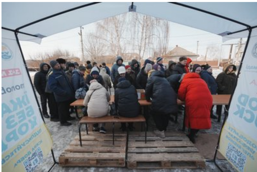
Черга за гарячими обідами у Дергачах на Харківщині, 24 лютого 2025 року.

"Як би не було, але воно виручає, пенсія маленька, дуже дорогий газ, світло. Якби це було весь час, то за допомогою цього можна було жити, поки не закінчиться війна", — говорить житель Дергачів.