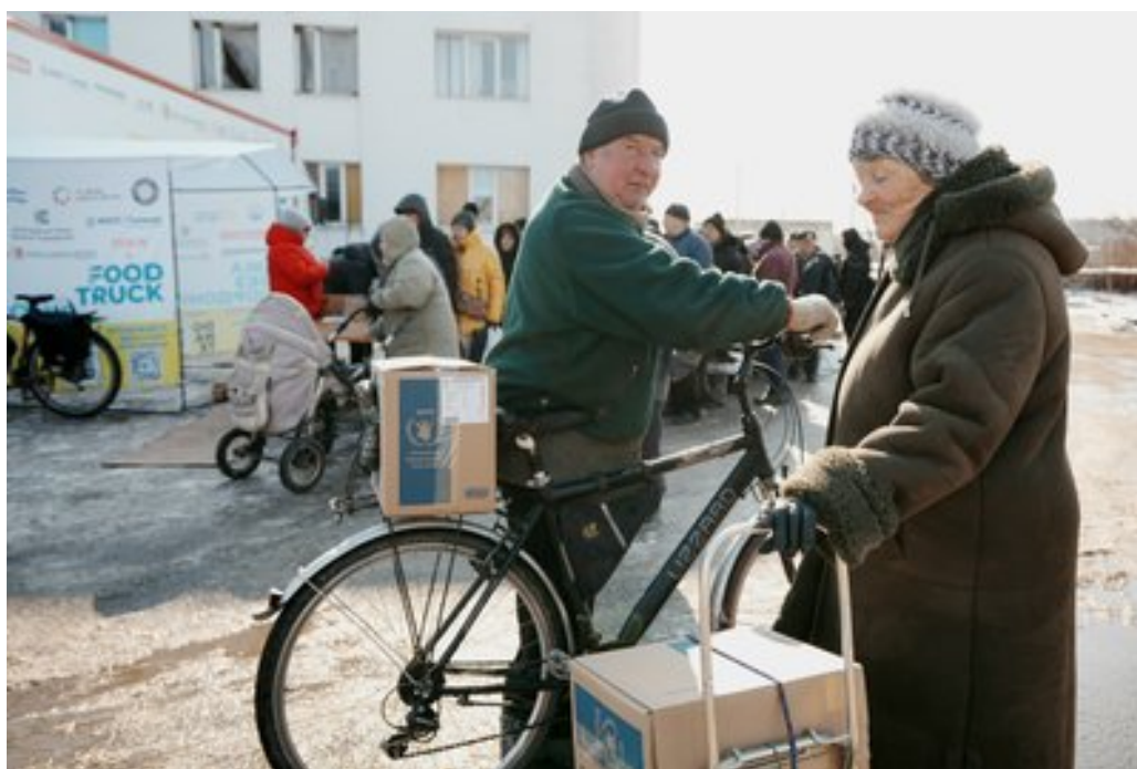
Жителі Дергачів отримують гуманітарну допомогу, 24 лютого 2025 року.