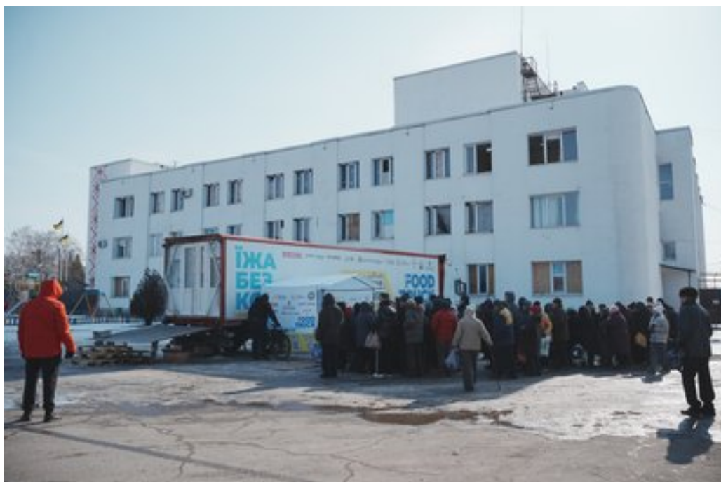
Черга за гарячими обідами у Дергачах на Харківщині, 24 лютого 2025 року.

За словами Задоренка, фудтрак працюватиме в Дергачах ще кілька тижнів.