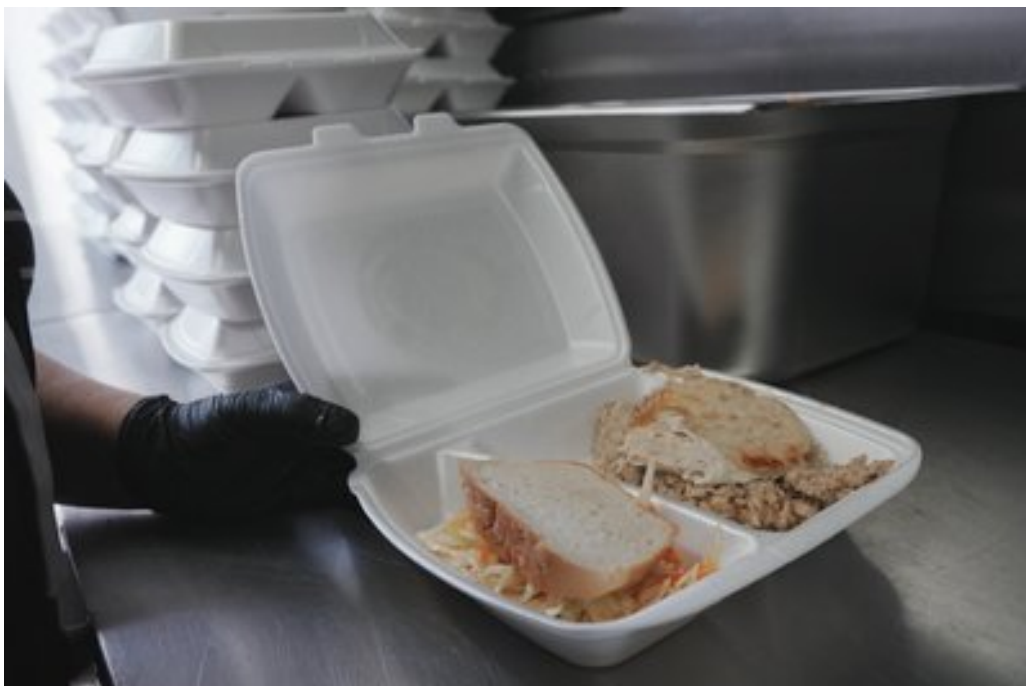
У фудтраку готують безплатні обіди для жителів Дергачів, 24 лютого 2025 року.