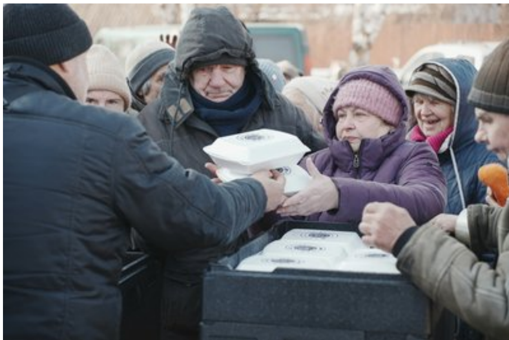
Жителям Дергачів роздають безплатні гарячі обіди, 24 лютого 2025 року.