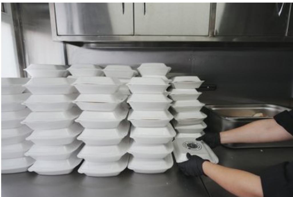
На Харківщині працює фудтрак, в якому готують гарячі обіди для тих, хто потребує, 24 лютого 2025 року.