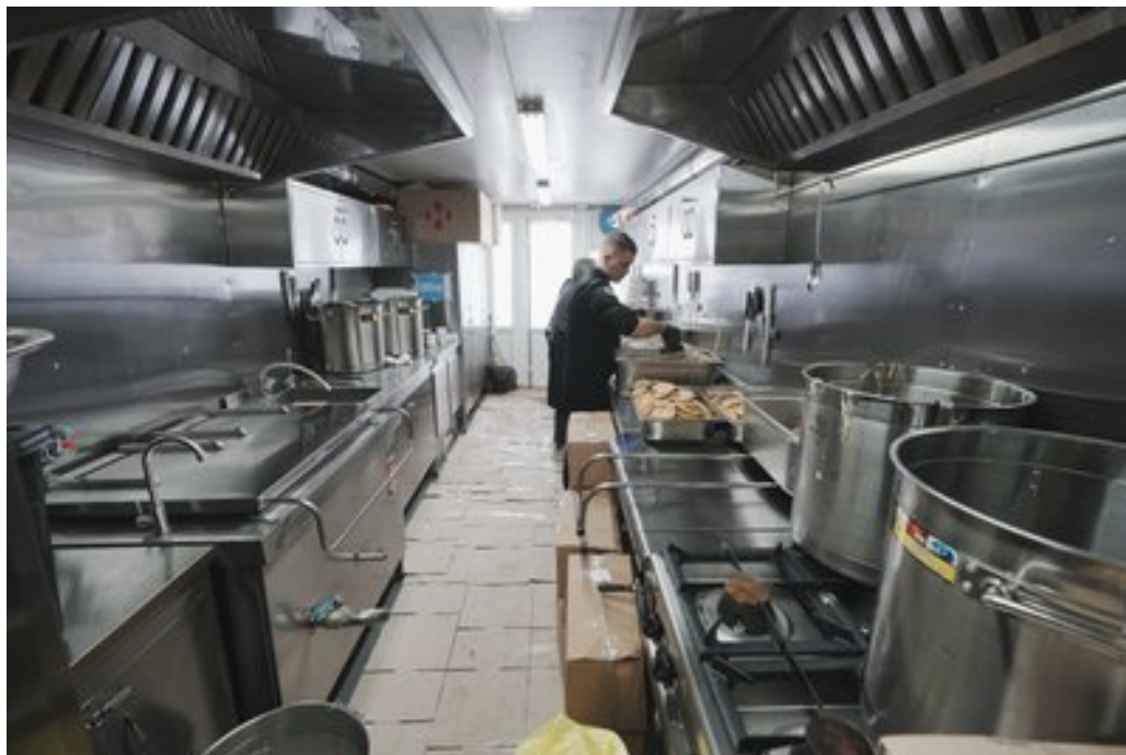
По дві тисячі гарячих обідів на день у прикордонній Дергачівській громаді на Харківщині готує й роздає "Фудтрак — їжа без кордонів", 24 лютого 2025 року.