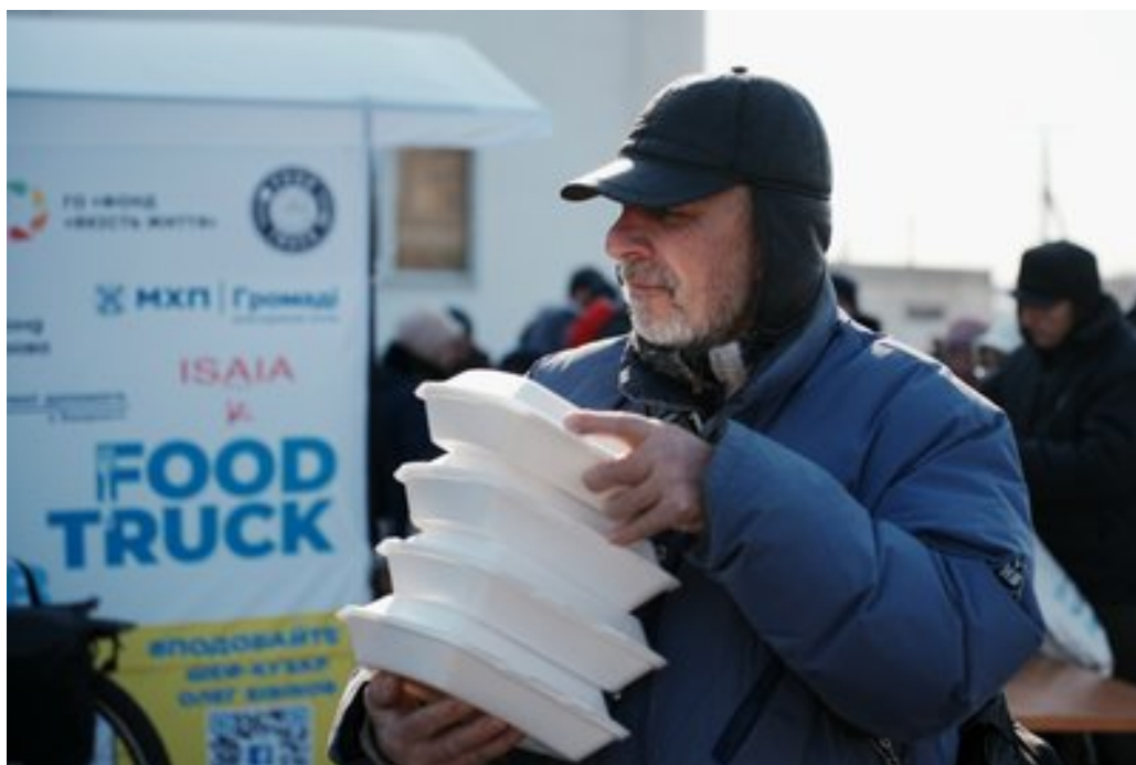
Жителям Дергачів роздають безплатні гарячі обіди, 24 лютого 2025 року.