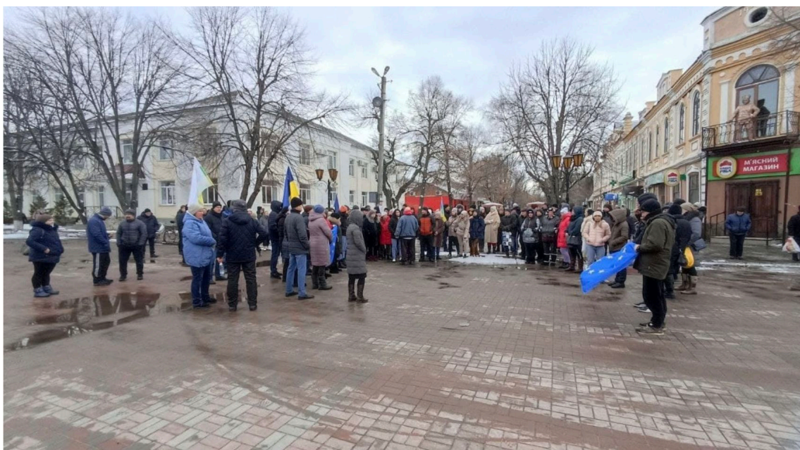
Мітинг у Старобільську.