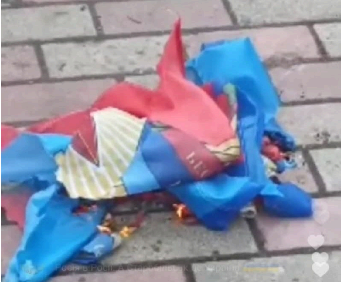
Спалений прапор так званої «лнр».