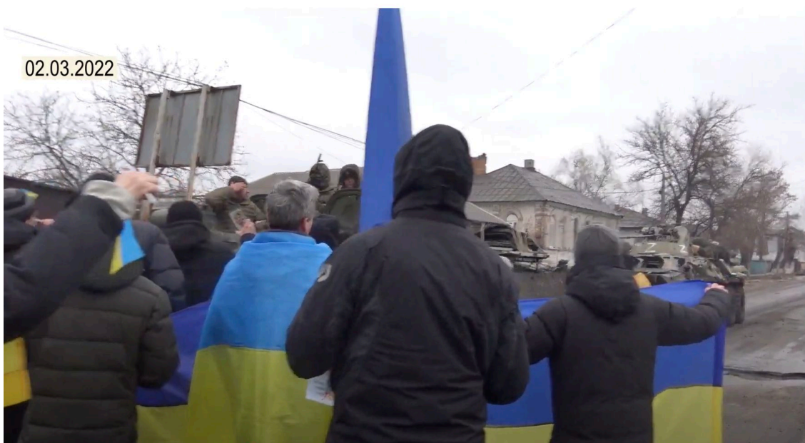
Мешканці Старобільська блокують техніку окупантів.