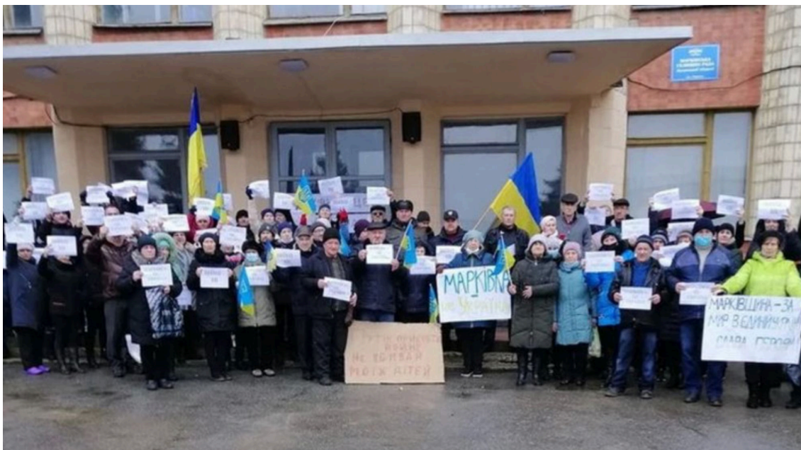
Мирний мітинг у Марківці.