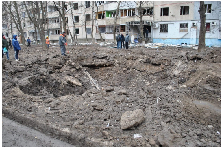
Ранок у Чугуєві.