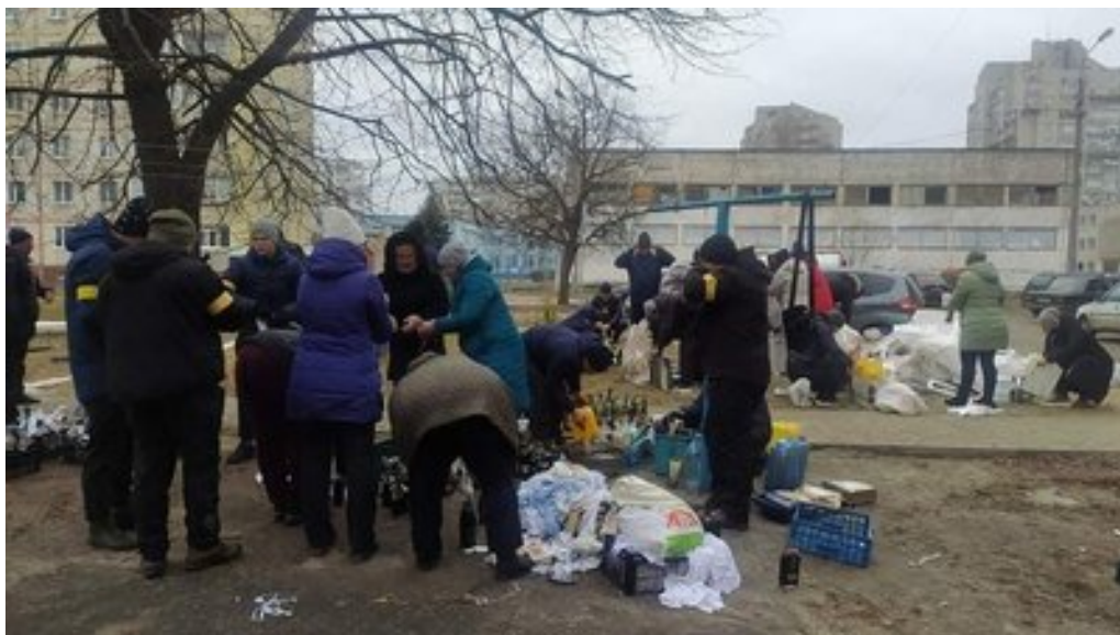
У Сумах містяни готують для росіян "Бандера-смузі" 1 березня 2022 рік.