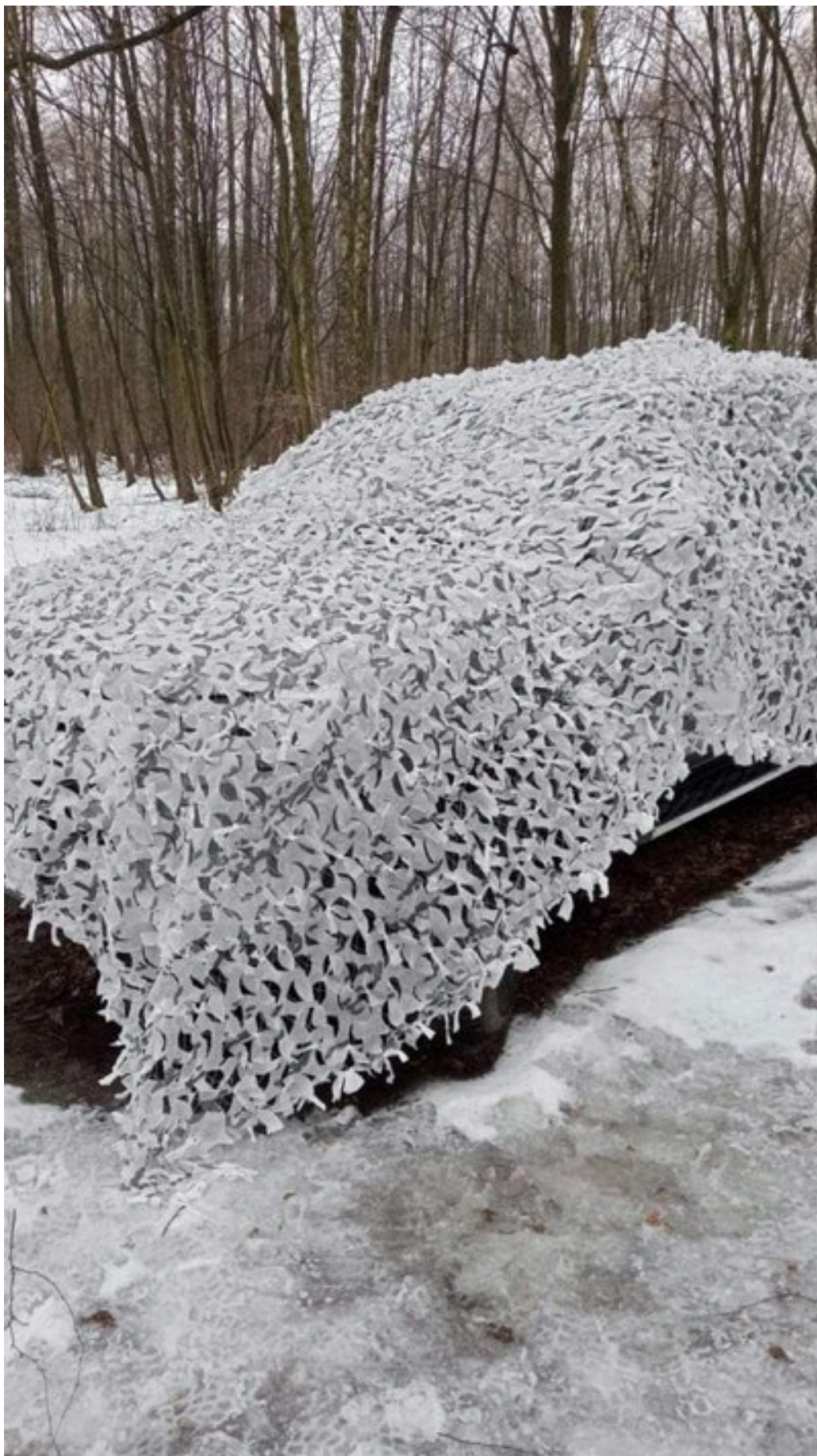
Волонтери із Сумщини виготовили маскувальних сіток на 71700 квадратних метрів.