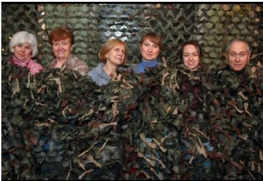
Волонтери із Сумщини виготовили маскувальних сіток на 71700 квадратних метрів.

Війна виходить на новий рівень. Сітки старого зразку були важкими і малофункціональними. Ми подумали, що треба вчитися чогось новому. Тоді почали шукати технологію виготовлення сучасних засобів маскуваня. Ми шукали фахівців з цього питання. Одним словом, повністю занурилися у цю тему. А потім наша колега привезла із-за кордону невеликий зразок НАТівської сітки. За її зразком ми почали виготовляти свої.