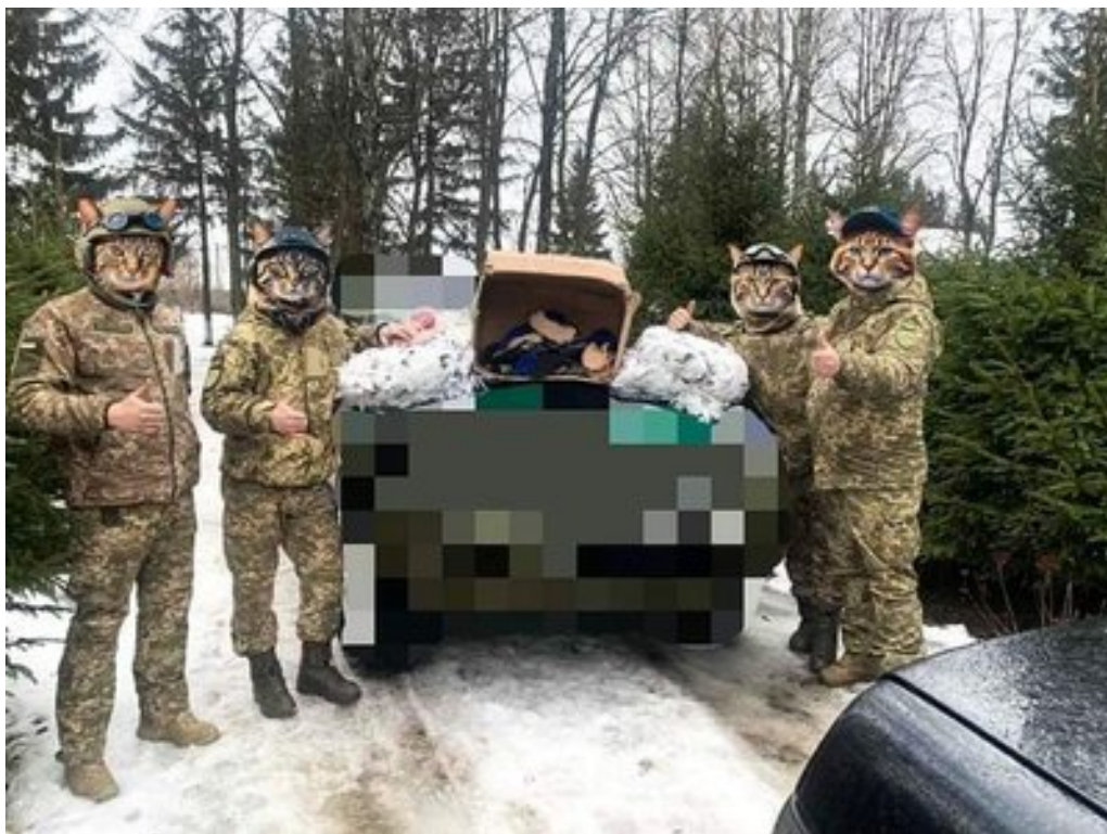
Волонтери із Сумщини виготовили маскувальних сіток на 71700 квадратних метрів.

Окрім сіток, волонтери БФ "Ми тут — Північний форпост" постачають захисникам і іншу продукцію.