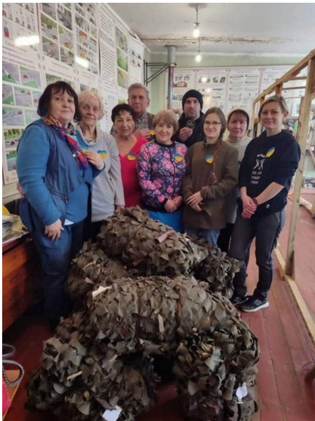
Волонтери із Сумщини виготовили маскувальних сіток на 71700 квадратних метрів. Суспільне Суми

хворобу пішов у вічність мій чоловік. Тоді я ніби то втратила крила. Але розуміння того, що через моє особисте горе, хлопці не мають страждати мене тримало. Підтримка родини та моїх дівчаток - дало новий поштовх.