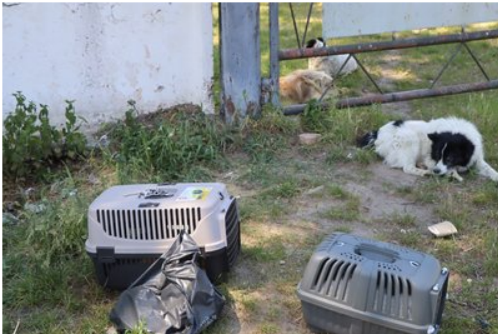
Тварини. Суспільне Суми

"Всі з вулиці, всі когось викидають. На цвинтарі викинули цуценят. Я не знаю, як це можна на кладовище принести й викинути на могилу цуценят? На одному цвинтарі, на іншому... То кішку трьохмастну взяли викинули під продуктовим маркетом. І викидають зазвичай ті люди, у яких є кошти", – говорить жителька Великої Писарівки Лариса Махмутова.