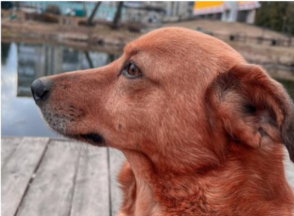
Балю.