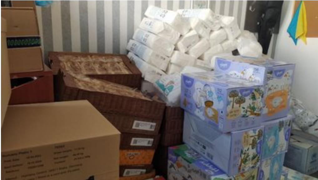
Волонтерська допомога. Суспільне Суми