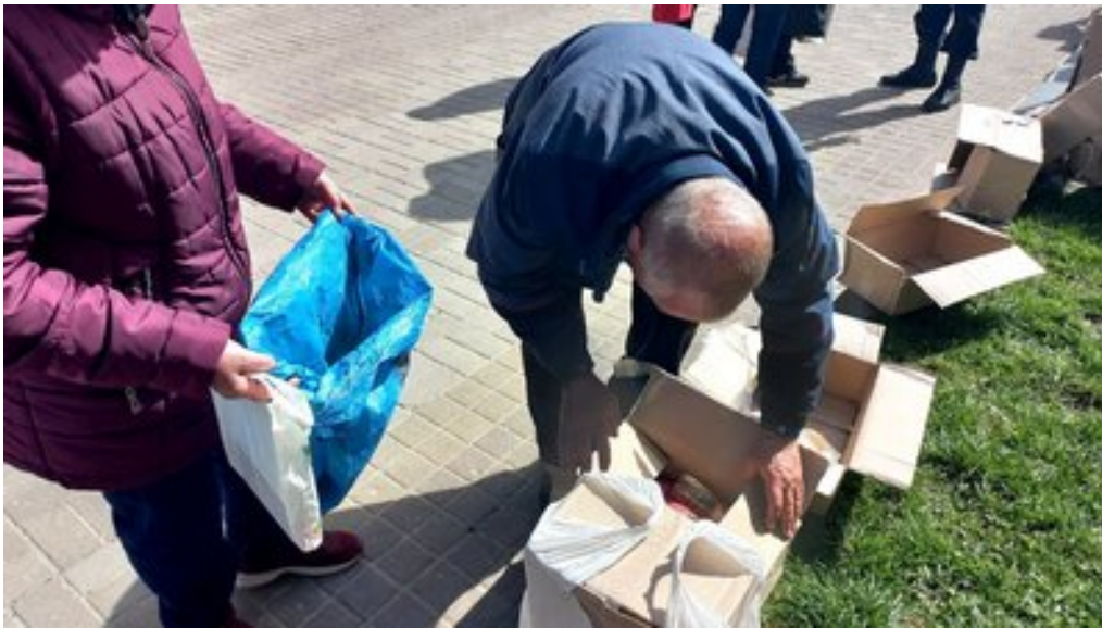
Серцем ми з Сумами. Видача гуманітарної допомоги дітям війни м. Суми 15.04.2022 р.

"У різних людей різна мотивація, але, думаю, що багато поляків від самого початку розуміють, що ця війна – не тільки війна Росії з Україною, Україна в якомусь сенсі захищає Польщу, Європу. Є такі люди, які просто не хочуть сидіти і нічого не робити. Я не солдат, не військовий, я не можу воювати разом з вашими солдатами, але можу бути волонтером, привозити гуманітарну допомогу. Я думаю, що для більшості людей є велике прагнення щось зробити, а не просто сидіти та чекати. Колись історія це оцінить. В майбутньому я хочу відчувати, що в той тяжкий для України час я щось робив, а не чекав. І це є моя мотивація".