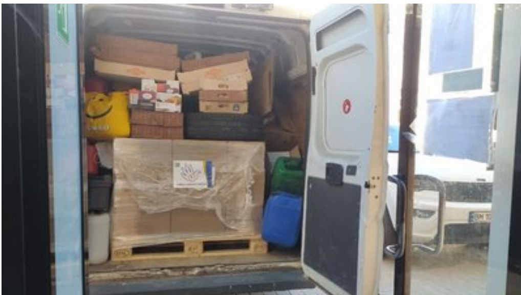
Волонтерська допомога. Суспільне Суми

Фундація Кордон допомагає українцям від початку повномасштабного вторгнення. Від 24 лютого 2022 року волонтери були одні з перших на кордоні, допомагали біженцям, годували, забирали, перевозили людей автобусами. Після цього почали їздити в гарячі точки: були неодноразово в Херсоні, в Запоріжжі — і це перший виїзд Фундації Кордон в Суми. Мене це дуже тішить, тому що я також є волонтеркою Фундації Кордон. Я два роки як українка в Варшаві й, врешті-решт, ми готувалися — і приготували виїзд в моє рідне місто. Ми привезли допомогу передусім для цих родин, які евакуйовані з сіл кордону, для старших людей, для родин з дітьми - це дуже цінно для нас.