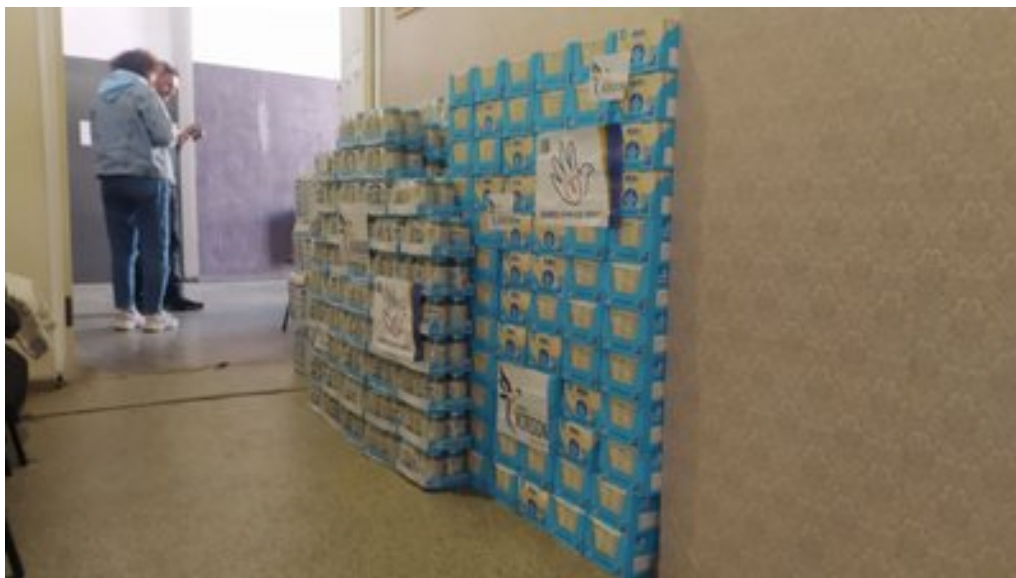
Волонтерська допомога. Суспільне Суми