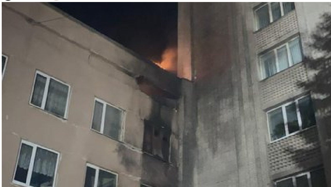
Наслідки російської атаки, Суми, 4 березня, 2025 р.