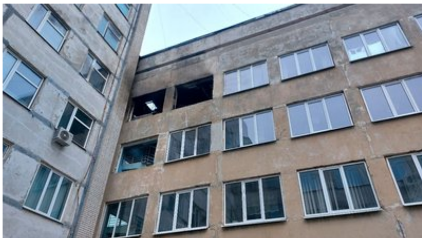
Наслідки російської атаки, Суми, 4 березня, 2025 р. Суспільне Суми

"Прийоми лікарі ведуть. Люди записані, діти хворіють, допомагати треба", — розказала старша медична сестра Лілія Суярко.