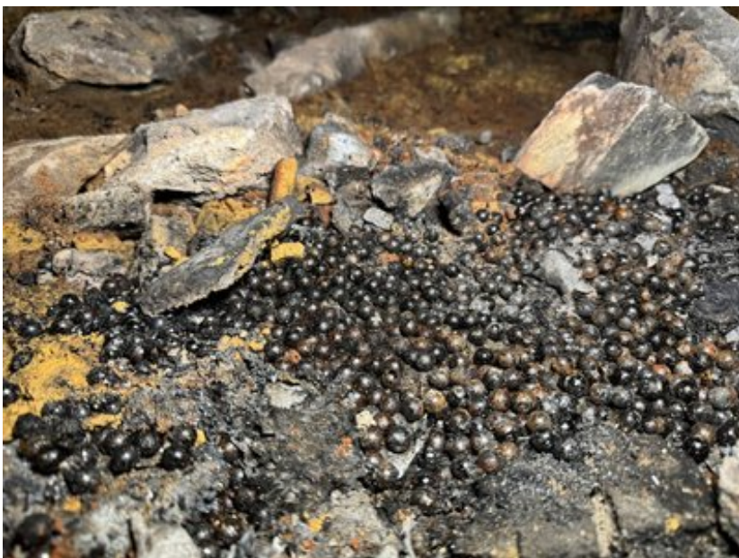
Шрапнелі. Суспільне Суми

У ДСНС показали, як ліквідували пожежу у приміщенні дитячого медичного закладу. Попередньо, поранених людей немає.