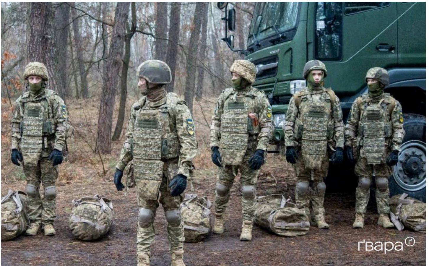
Рекрути проходять смугу перешкод / Фото: Сергій Прокопенко Гвара Медіа