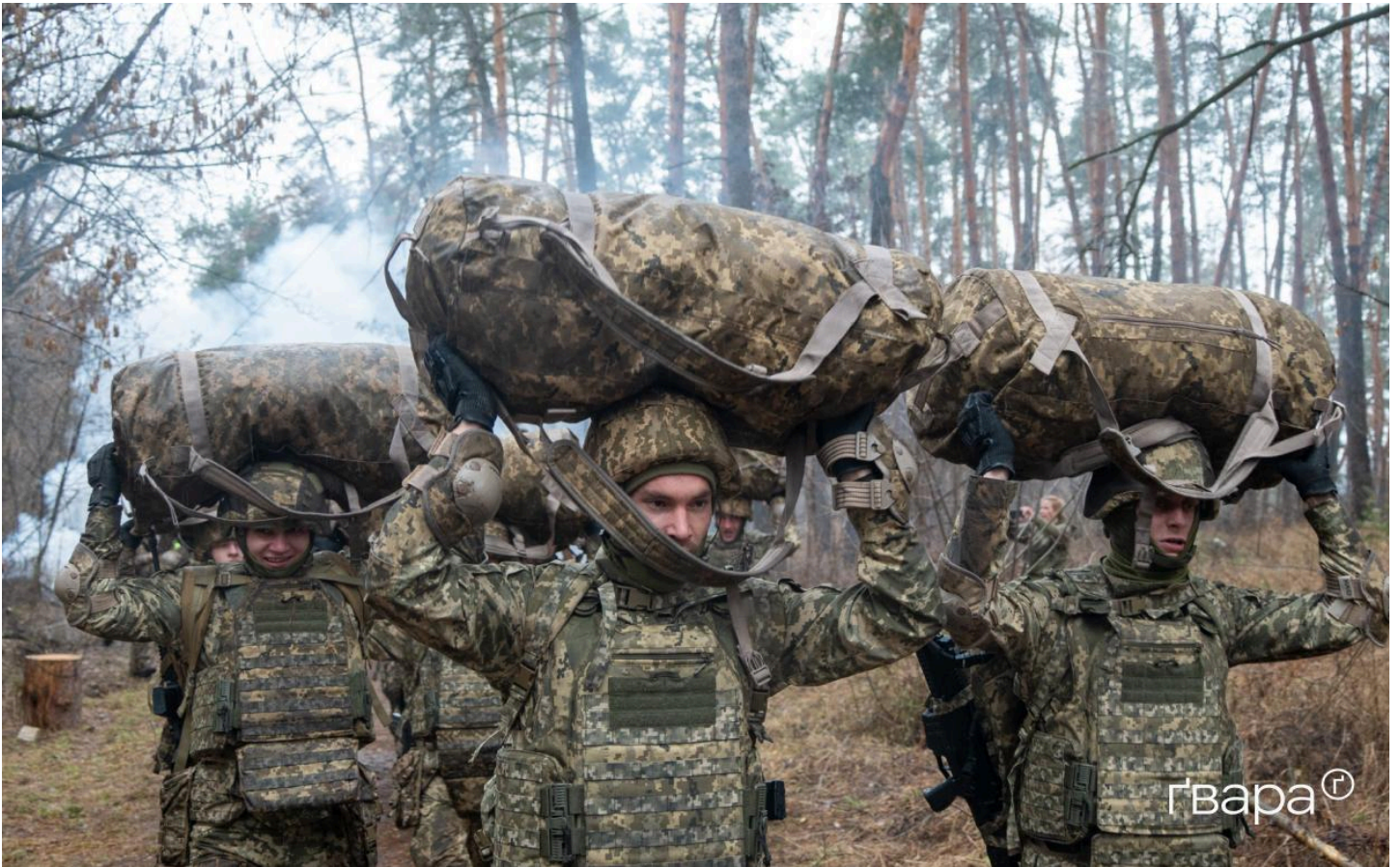
Рекрути проходять смугу перешкод / Фото: Сергій Прокопенко Гвара Медіа