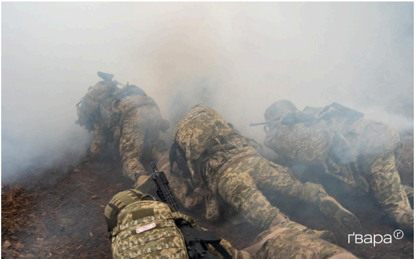
Рекрути проходять смугу перешкод

23-річний Владислав на позивний «Кола» говорить, що усі енергійні, вмотивовані та готові до навчання.