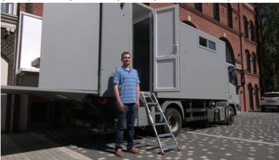
Стоматологічний кабінет на колесах для ЗСУ. Суспільне Рівне