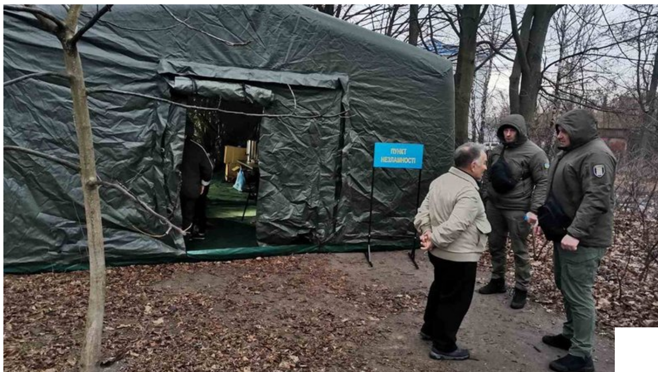
Пункт незламності поблизу місця влучання російського дрона у Чернігові.

"Від самого ранку починають працювати інші міські комунальні підприємства для виконання першочергових аварійно-відновлювальних робіт, а також обстеження пошкодженого майна. Здійснюватиметься прибирання території", — йдеться у повідомленні.