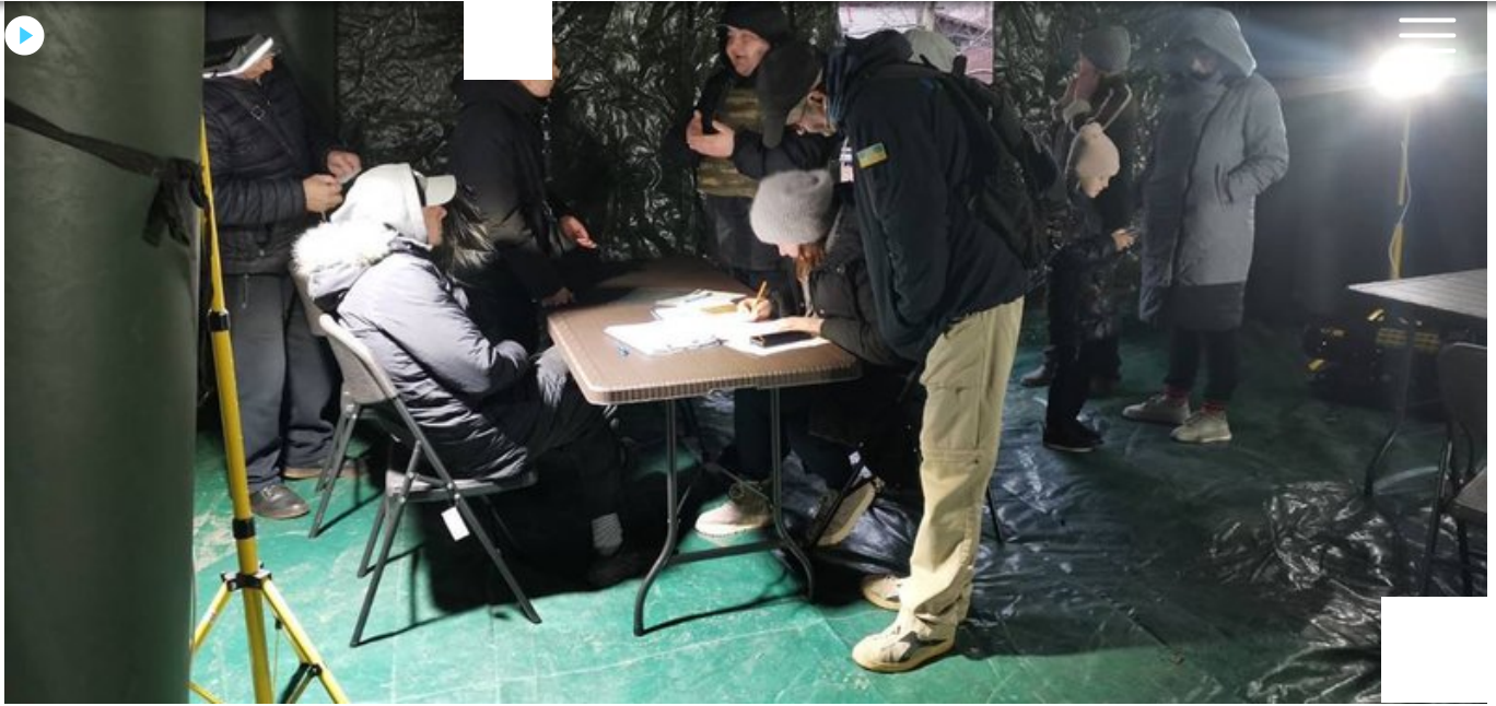
Пункт незламності поблизу місця влучання російського дрона у Чернігові.