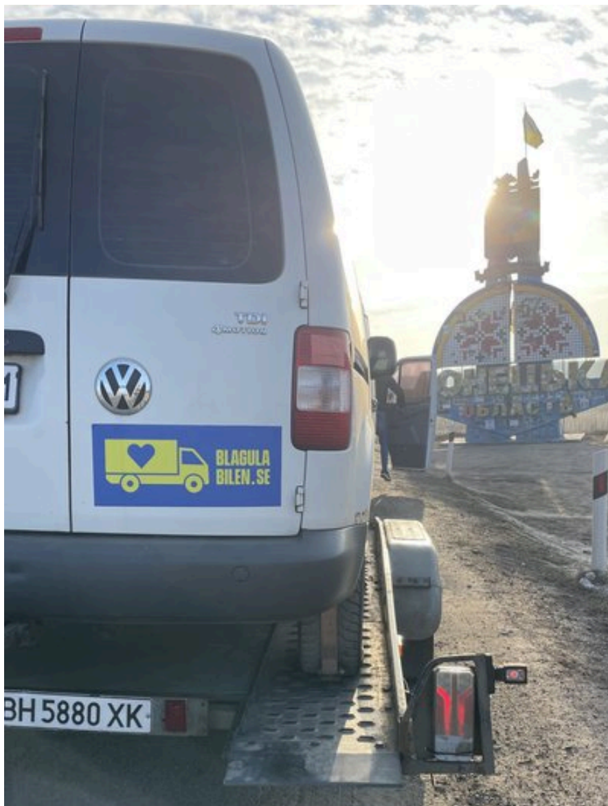
Автівку, яку придбав благодійний фонд "Гонор", везуть військовим.