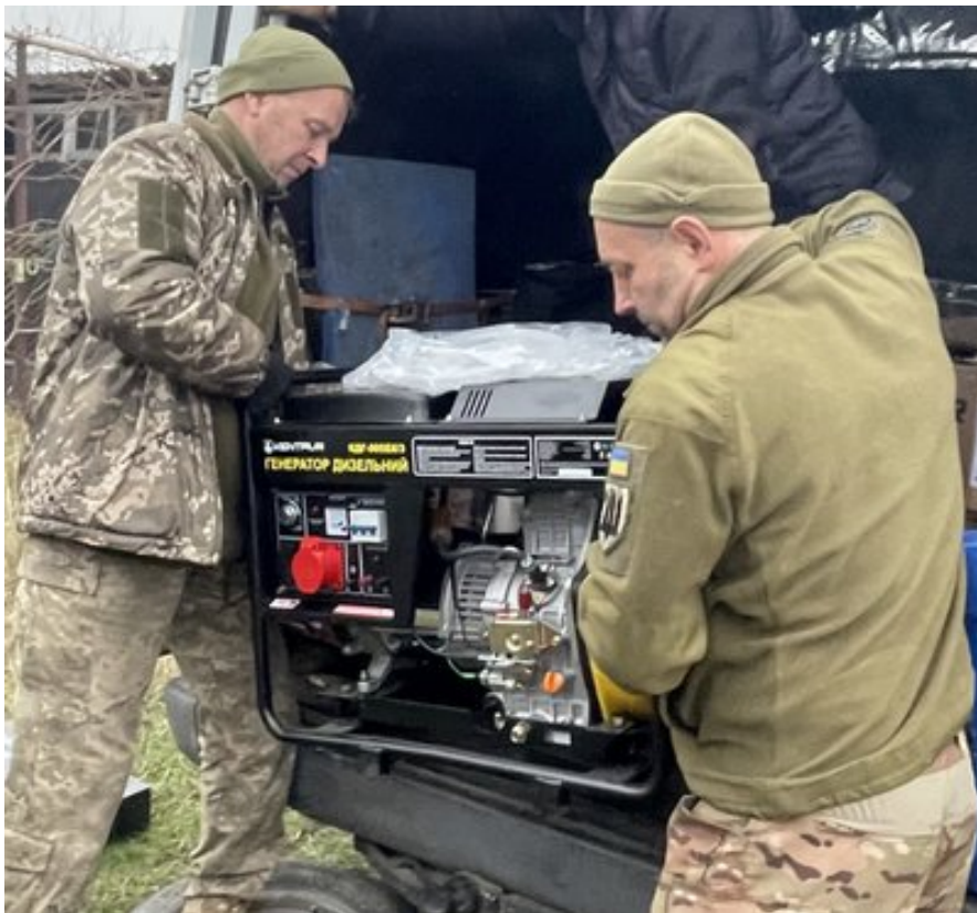
Військові розвантажують генератор, що для них придбав благодійний фонд "Гонор".