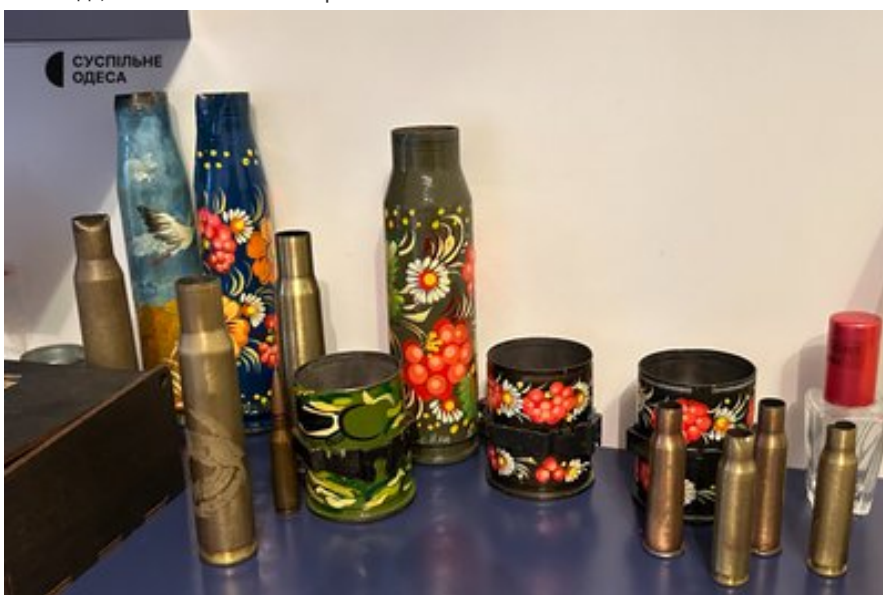
Гільзи з гравіюванням та Петриківським розписом.

"Я за енергообмін. Люди жертвують кошти, і я хочу, щоб вони отримували щось пам'ятне, щоб через мене передавали також і свою вдячність, щоб вони відчували свій вклад", — пояснює волонтерка.