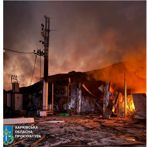
Фото наслідків удару по Богодухову