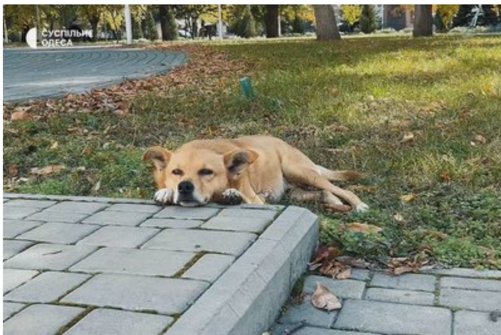
Безпритульна собака на вулицях Ізмаїла.

Він також додав, що останнім часом почастишали випадки наїзду на тварин.