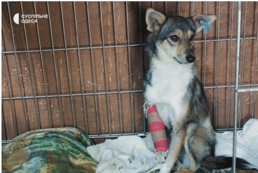
Безпритульна собака, яку лікує зооволонтер. Суспільне Одеса

"Не всі люди готові взяти собі тварину, але такі є. Я дуже ціную, що мені вірять, дивляться на мою діяльність і підтримують. Є ті, хто мені постійно допомагає. Є люди, які взагалі не з цієї країни, не з цього міста. І в Ізмаїлі також дуже багато людей, хто мене підтримує".