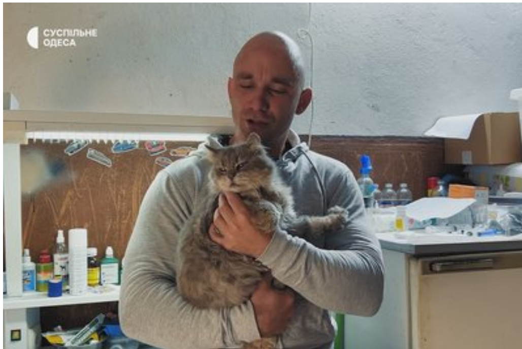
Кіт, якого волонтер знайшов збитим на трасі. Суспільне Одеса

"У нас люди можуть спокійно їхати, збити тварину і поїхати. Коли люди бояться фінансових витрат — це одне. Інша справа, коли людям просто байдуже. Завжди можна звернутись до волонтерів, принаймні спробувати. У мене не один раз було таке, що люди збивали тварину і дуже хотіли допомогти", — додав чоловік.