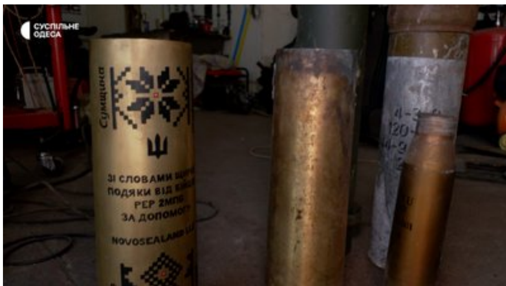
Трофеї з фронту, що розіграють на аукціоні. Суспільне Одеса