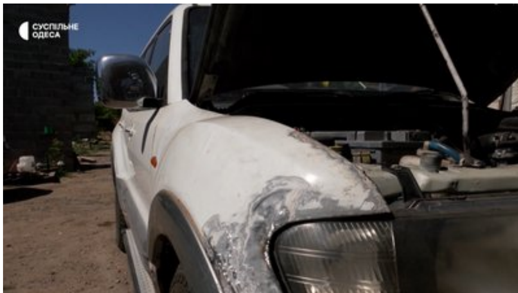
Автівка, яку ремонтують волонтери.

"Мав сідати мій брат рідний у Дніпрі за кермо цієї машини. Ми мали її своїм ходом гнати вже на Покровськ. І так вийшло, що на узбіччі роблять такі "лівньовки", щоб вода стікала. Я лафетом хапаю цю "лівньовку" і вона починає розхитувати машину. Мені довелось вивернути кермо й ударити машину у відбійник, щоб її втримати на колесах. Я потім вийшов, подивився — а за три метри обрив і озеро. Страх був більше за кохану людину, яка знаходилась поряд. Найгірше те, що ми не довезли вчасно ту машину. Ми її повернули назад, щоб зробити ще раз ремонт".