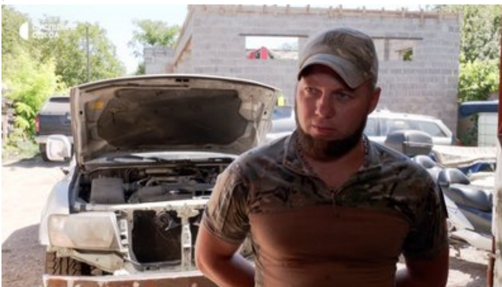
Військовий та волонтер на псевдо "Кіт".

Невеликий РЕБчик допомагає в тому, щоб не вдарив FPV-дрон, а у нас на цьому заробляють".