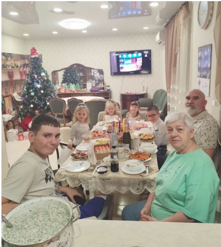
Велика родина Карпцових