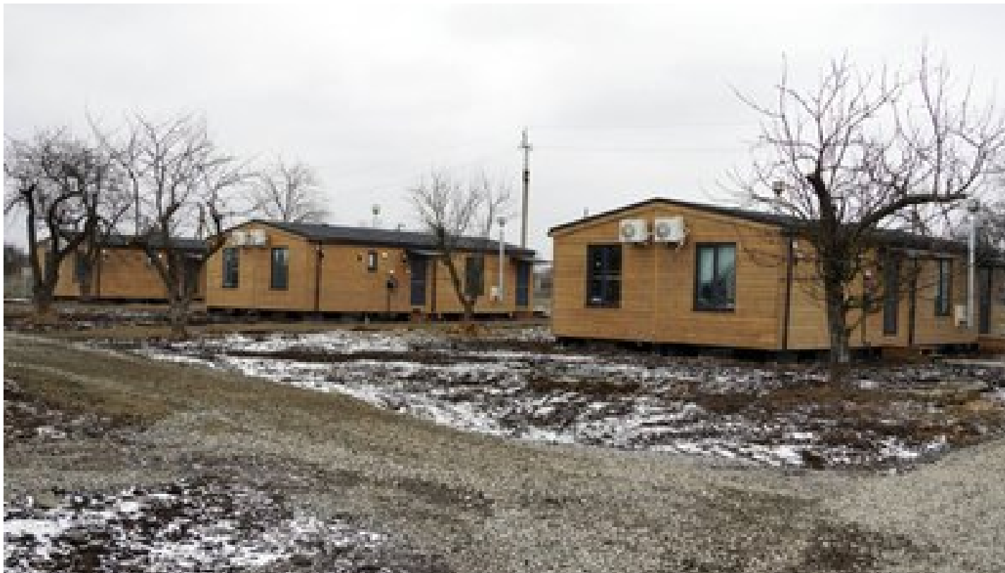
Модульне містечко на Сумщині.