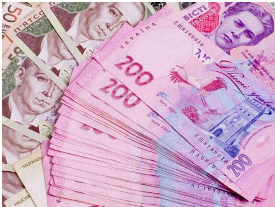
Фото ілюстративне із відкритих джерел

Кабінет Міністрів України розподілив 13,5 мільярда гривень на проєкти відбудови