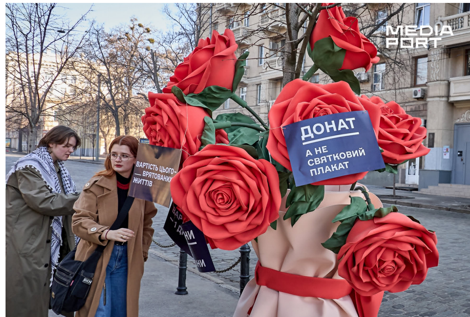
У міськраді не називають імен благодійників, посилаючись на захист персональних даних

Представниці Харківського жіночого об'єднання «Сфера», а також організацій «Центр гендерної культури», «Крок в нове життя», «Позитивні жінки», «Вік Можливостей», «Радолада», «Жіноча Асоціація «ПРО ЖІНОК...», «Харківський фонд психологічних досліджень» та «ГРІН-ЛАНДІЯ», які належать до коаліції «Харківщина 1325», склали відкритий лист Харківському міському голові Ігорю Терехова, в якому звертають увагу на текст його вітальних плакатів.