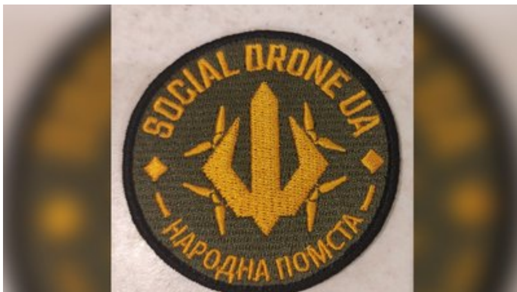
Шеврон спільноти Social Drone.

Дрони передаються військовим Сил Оборони, що перебувають у зоні бойових дій та першочергово потребують забезпечення.