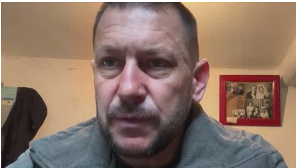
Військовий на позивний "Ложка", т.в.о командира роти 117 ОМБ. Суспільне Запоріжжя

Боець на позивний "Ложка" та його підрозділ співпрацюють з волонтером і отримали від нього вже близько 30 FPV. Коли відбивали штурм, "пташкою" вдалося ліквідувати п'ятьох військових РФ та дрони все ж доводиться допрацьовувати самотужки, поділився військовий: