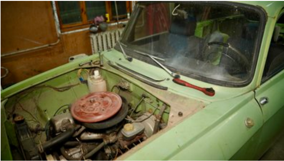
"Москвич" який переобладнують в евакуаційне авто. Суспільне Запоріжжя