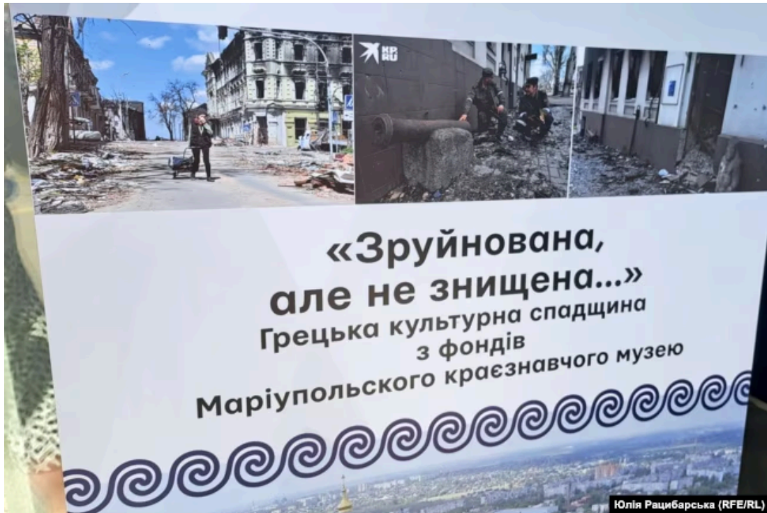
Виставка оцифрованих експонатів Маріупольського краєзнавчого музею, Дніпро, 2023 рік

«Збираємо й експонати, й усні історії. Маріупольці розлетілися по різних країнах, континентах. І зараз – нова історія, історія Маріуполя як міста-переселенця. Моє сподівання: маріупольці набираються досвіду, і більша частина повернеться до міста, і зможуть його відбудувати, зробити більш яскравим, комфортним. Ініціатив буде багато. У багатьох дуже травматичний досвід. Але люди пройшли це і зрозуміли, що сил у них набагато більше, ніж вони думали», – переконаний чоловік.