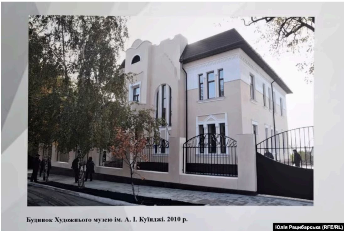
Будинок Художнього музею ім. А. І. Куїнджі. 2010 р.