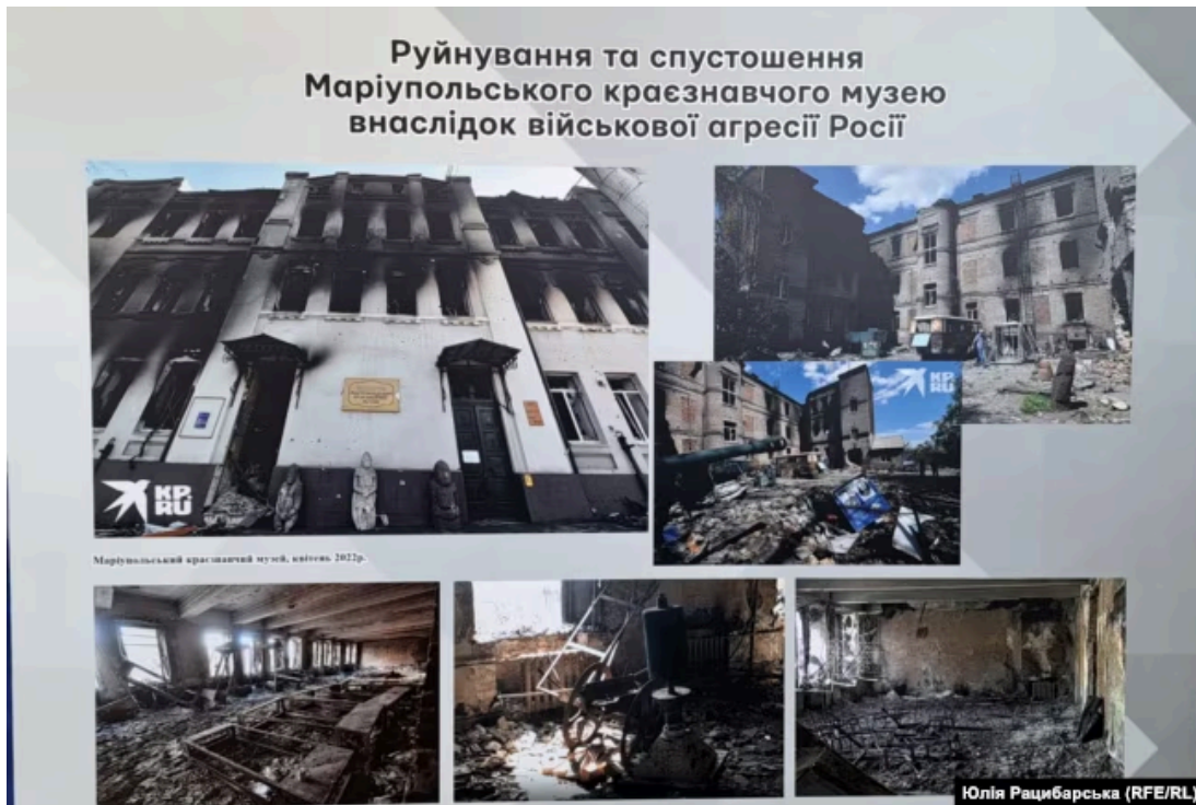
Зруйнований музей, весна 2022 року

«Вікна на фасадній частині були вже побиті, питав у людей, що та як, але до самої будівлі не заходив. Мови про евакуацію музею не було. А куди евакуюватися?... Та й процес це тривалий, з досвіду інших музеїв – кілька місяців, потрібні були упаковочні матеріали й робочі руки, нічого цього в нас не було. У нас уже самих не було можливості виїхати», – каже музейник.