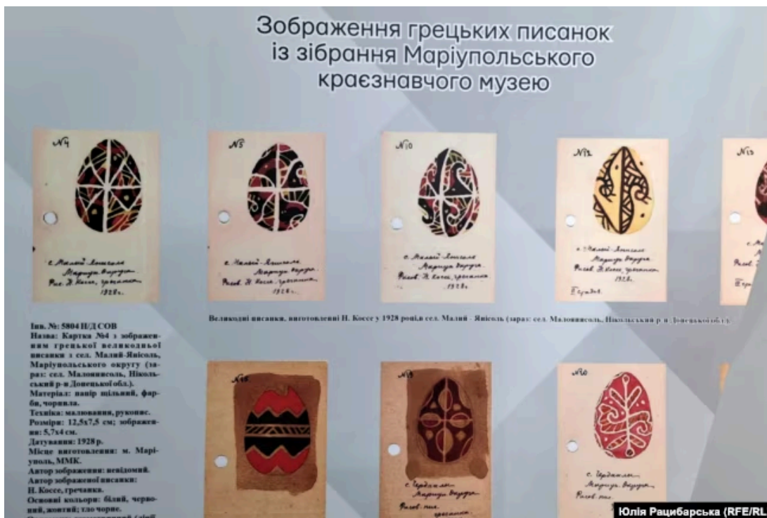
Виставка оцифрованих експонатів Маріупольського краєзнавчого музею, грецькі писанки

Усе це можна побачити на виставці, яка нині подорожує вільною територією України. Фінансово цей проєкт підтримав Грецький культурний центр , який діє в Одесі.