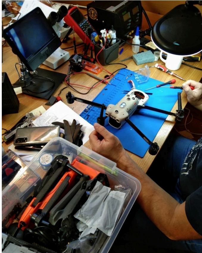
Ремонт дронів.

"Халабуда" продовжує отримувати підтримку від партнерів та писати власні грантові заявки для підтримання колективу та існування простору загалом.