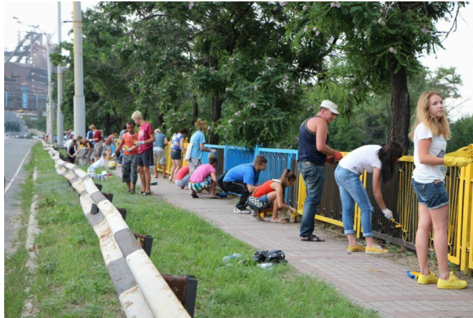
Фарбування постмосту.