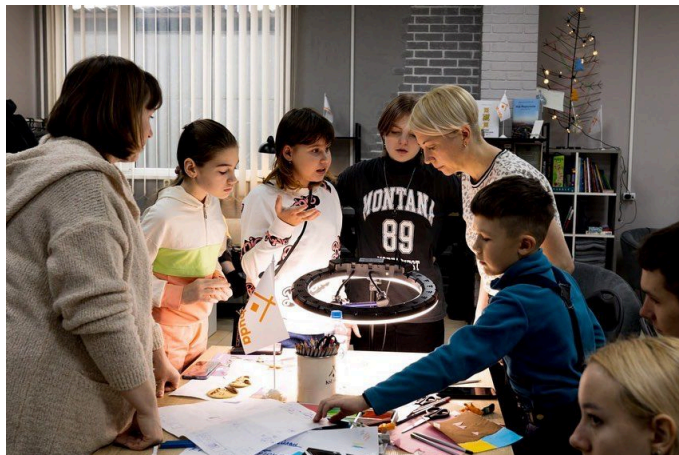
Робота з дітьми.