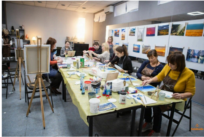
"Халабуда" у Маріуполі.

діячами. Окрім цього, волонтери влаштовували кінопокази, проводили лекції, запрошували цікавих спікерів. На початку 2022 року "Халабуда" була не просто освітнім хабом, а майданчиком громадянського суспільства та саморозвитку.