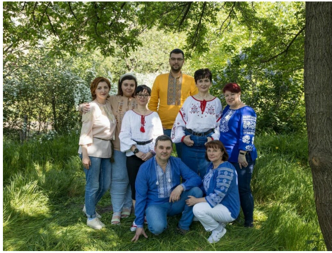
Команда "Халабуди".