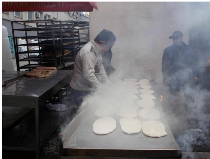
Волонтери готують у "Халабуді" у Маріуполі.

У перші дні повномасштабної війни у Маріуполі вже були перебої з постачанням їжі та води, волонтери розуміли, що ситуація може погіршуватися. Тому 25 числа частина команди виїхала до Запоріжжя, щоб мати змогу звідти надсилати допомогу до Маріуполя та тримати зв'язок. Та, на жаль, реалізувати задум майже не вдалося. Вже через кілька днів Маріуполь опинився у блокаді.