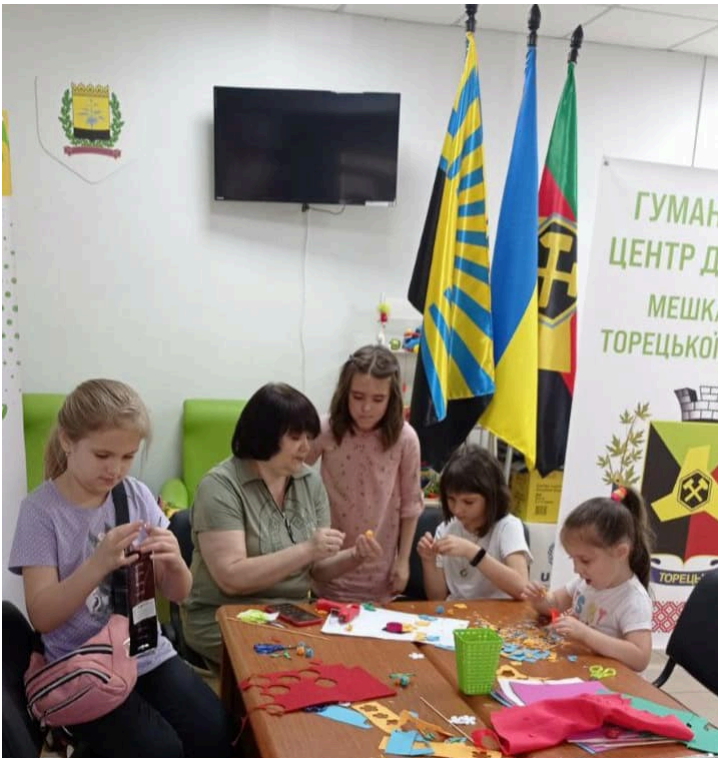
За інформацією управління культури і туризму облдержадміністрації