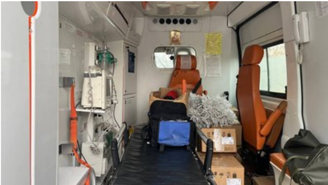
Обладнання у швидкій допомозі.