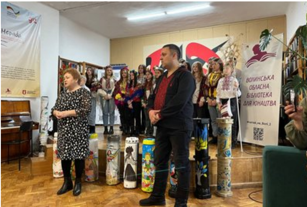
"Діти Небесного Легіону" колядують у бібліотеці.

Упродовж дня, зазначив організатор Руслан Теліпський, "Діти Небесного легіону" колядували і посівали у 15 організаціях, які запрошували дітей.