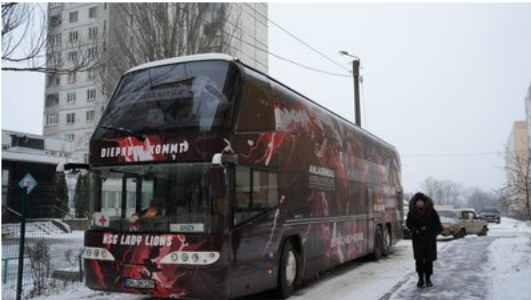
Автобус з подарунками, які передали з Німеччини, Харків, січень 2024 року.

Двоповерховий волонтерський автобус повністю завантажили подарунками. Частина з них передали до харківського гуртожитку, де живуть родини переселенців.