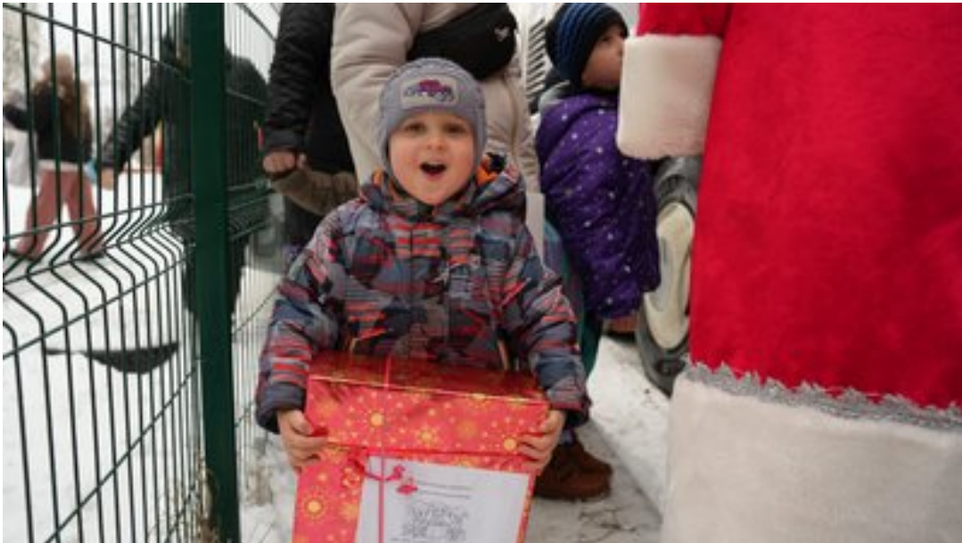
Хлопчик-переселенець отримав подарунок від волонтерів з Німеччини, Харків, січень 2024 року.

"Це дуже приємно! Такі відчуття, які не передати. Дитина допомагає нашим дітям".