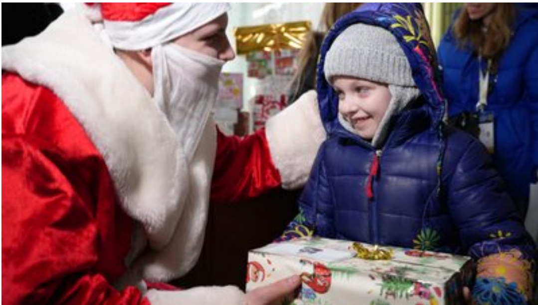
Дівчинка-переселенка з подарунком, Харків, січень 2024 року.

Волонтер з Німеччини Андреас Поршке на четвертий день повномасштабного вторгнення поїхав евакуювувати українців, возив людей від кордону. Після дев'ять разів приїздив до українських міст з гуманітарною допомогою.