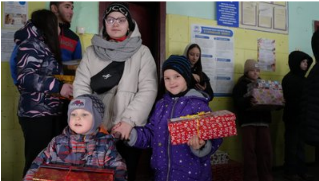
Діти-переселенці отримали подарунки, Харків, січень 2024 року.