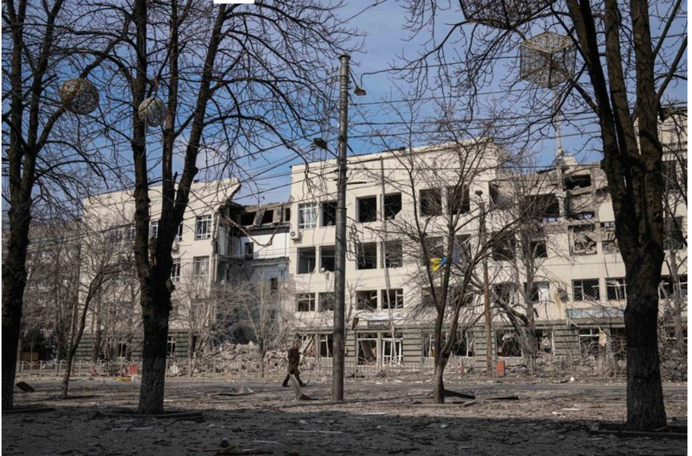
Маріуполь, проспект Миру, 13 березня 2022 року.

Все свистіло, летіло, але я дійшла до дому. Знаєте, якась така думка була: потрібно попрощатися. Я піднялась до квартири, закрила вибиті вікна, рами позакривала, бо в нас там вже багато чого повилітало. Взяли з дитиною якісь речі, й так під обстрілами повернулись на роботу до бібліотеки. Й буквально за пів години приїхала машина. Коли я виїжджала з бібліотеки, там залишалось всього восьмеро людей.