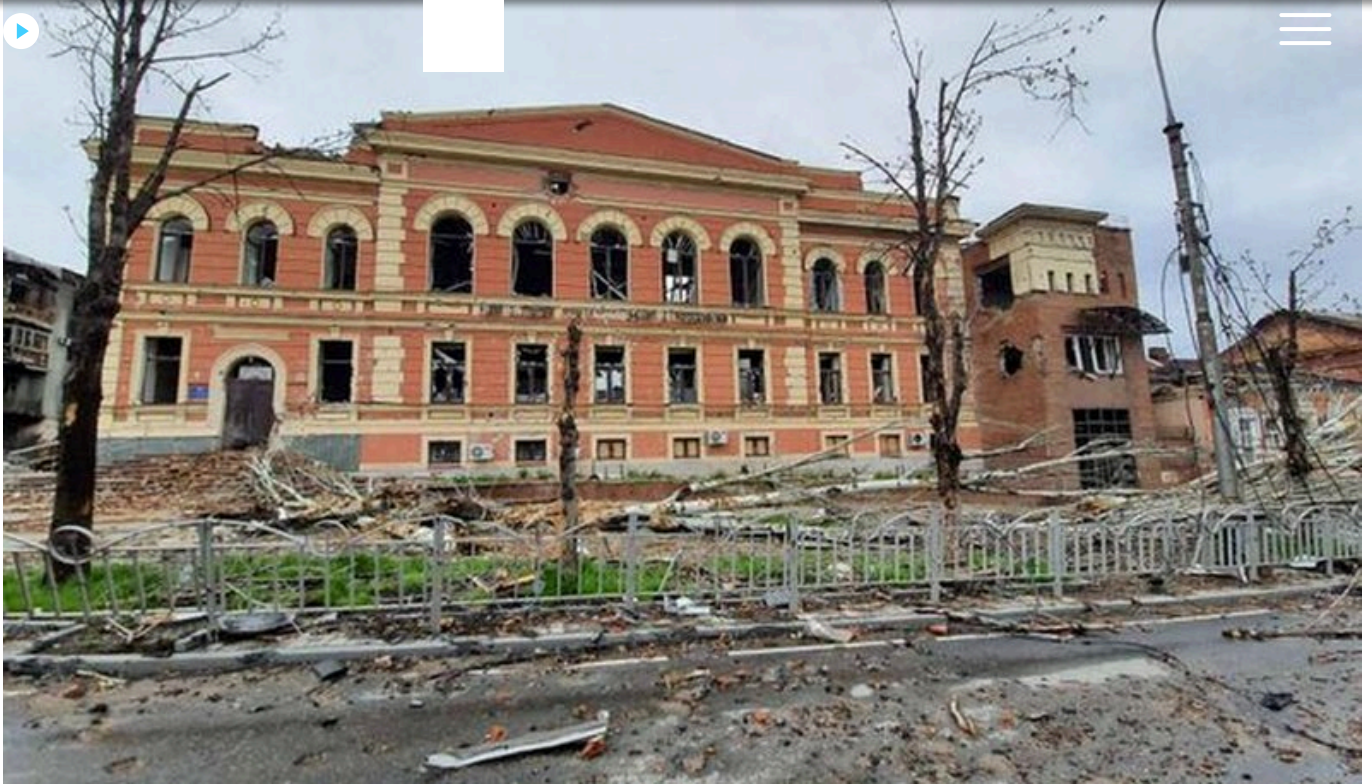
Будівля бібліотеки після обстрілів та бомбардувань.

Десь, щось ще працювало, але чим далі, тим було складніше й складніше. Ми вже чули оці літаки, ці бомбардування. Все літало над нашими головами. Ночі ці були безсонні.