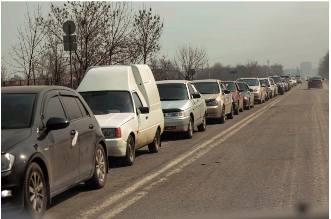
Машини на трасі виїждять з Маріуполя, 24 березня 2022 року.

Ми виїхали з бібліотеки о пів на дванадцятю, і до Мангуша ми потрапили о 8-й годині вечора, бо там була колона. що просто все тихенько, тихенько, все було в полях це все ми стояли довго й довго. Й там в полях пробився перший зв'язок. Я тоді змогла зв'язатись з чоловіком, з мамою, яка залишилась там під Маріуполем. Дізнались, що живі.