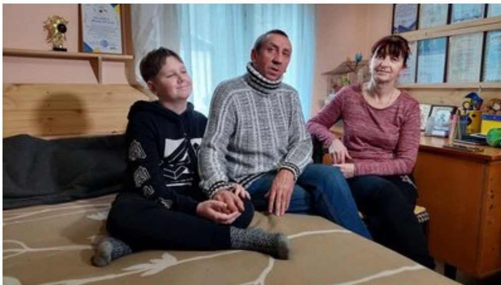
Родина Зарічних вдома, 5 січня 2024.

"Я захотів співати та збирати кошти для наших Збройних Сил України. Я ходив, колядував-колядував, і вирішив, що треба п'ять тисяч відкласти для дрона. І потім я ще доспівав кошти й відправив дрончик. Я не знаю, чи тато буде рахуватися, але він мені допомагав носитися з колонкою", — розповідає Максим.