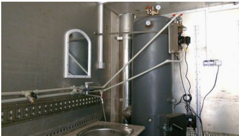
Бойлер в автівці.

Також в автомобілі є розетки та світло. Аби не було замикань, обладнали електричний щиток.