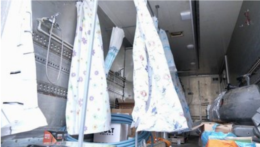
Візна душова та пральня.

Імена інженерів волонтери не називають, також не кажуть у скільки обійшовся такий автомобіль.