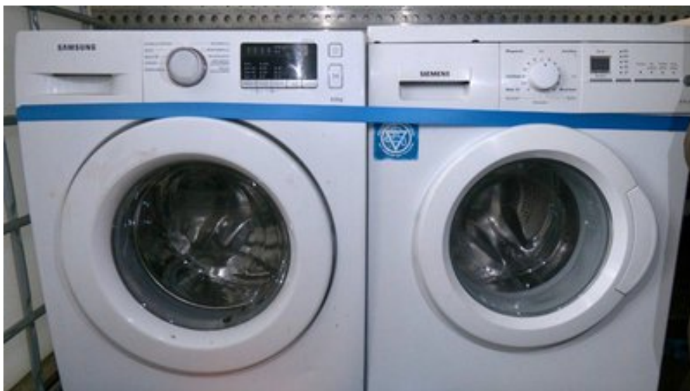
Пральні машинки.

"Пральний порошок, шампуні різні положили хлопцям, а також рушники. Щоб хлопці одразу прийшли, включили та помилися".