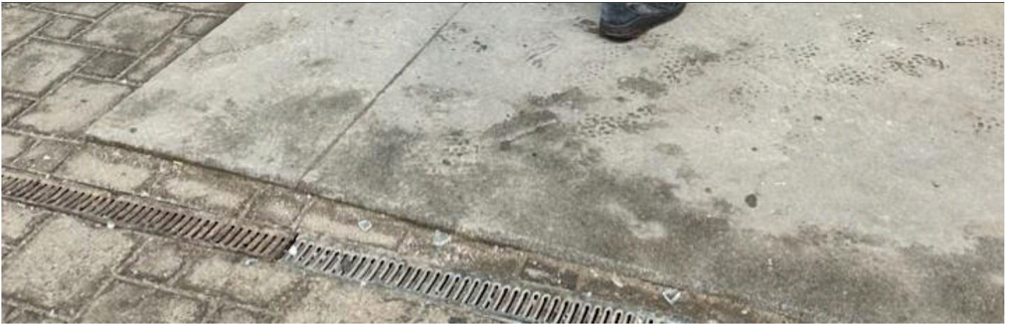
Пошкодження дитячого центру внаслідок удару РФ / Фото: БФ «Мирне Небо Харкова»

«Але ми маємо велику потребу продовжувати нашу діяльність. Адже щодня нас відвідувало близько 110 дітей дошкільного віку, більшість з них — внутрішньопереміщені особи. Для них ми проводили по 6 занять – навчальні, психологічні, розвивальні. А двічі на місяць – творчі майстер-класи. Також ми єдиний такий хаб, де діти були забезпечені харчуванням», — пояснили у фонді.