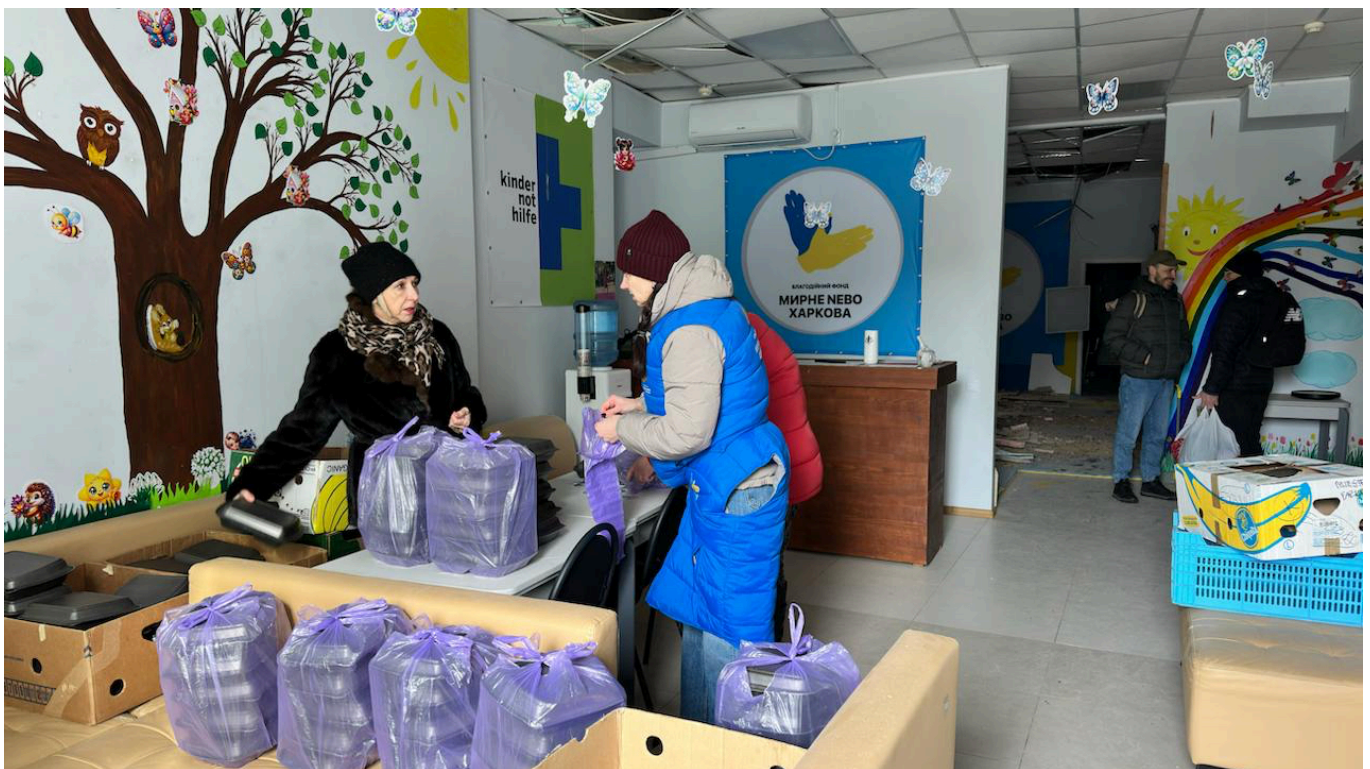
Пошкоджений дитячий центр внаслідок удару РФ

«Але ми маємо велику потребу продовжувати нашу діяльність. Адже щодня нас відвідувало близько 110 дітей дошкільного віку, більшість з них — внутрішньопереміщені особи. Для них ми проводили по 6 занять – навчальні, психологічні, розвивальні. А двічі на місяць – творчі майстер-класи. Також ми єдиний такий хаб, де діти були забезпечені харчуванням», — пояснили у фонді.