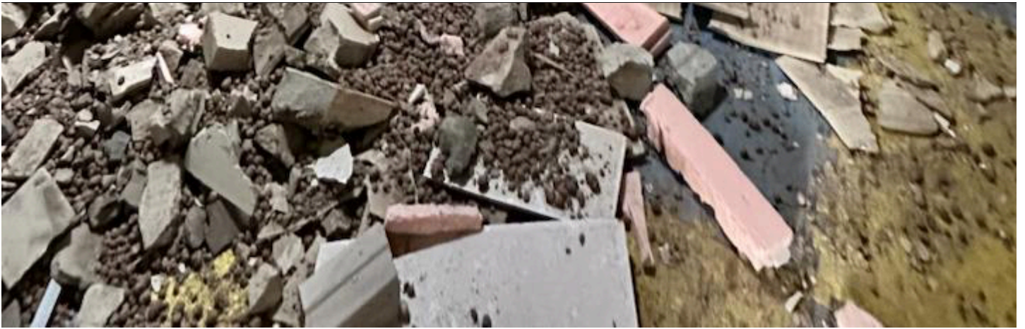
Пошкодження дитячого центру внаслідок удару РФ