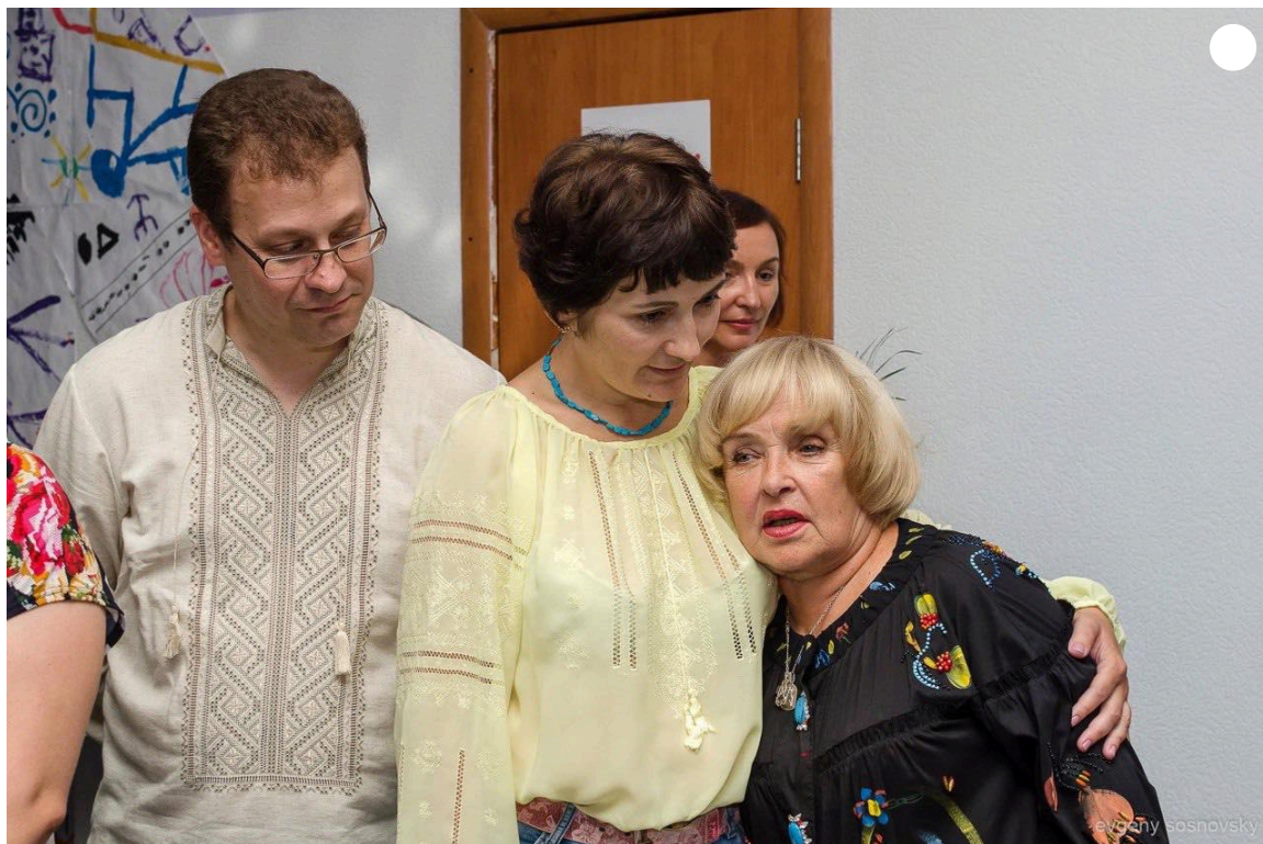
З народною артисткою України Адою Роговцевою.

Проводили творчі зустрічі з відомою українською акторкою Адою Роговцевою , робили презентації україномовних книг, майданчик для цього в “Халабуді” надавали безплатно.