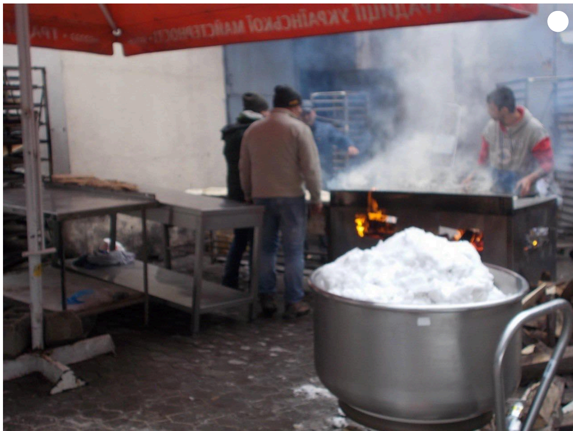
Волонтери готують їжу в "Халабуді".

Возили їжу й на "Азовсталь", поки могли дістатися туди. Хліб і вода — найперше. Перестали їздити, коли перекрили дорогу через небезпеку, приблизно 7–8 березня.