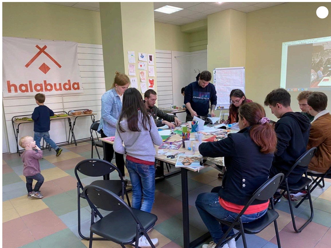
Під час занять в "Халабуді".

Був намір створювати освітні програми для переселенців, які лишилися жити в Маріуполі, пропонувати їх на безплатній основі. Так на базі волонтерки з'явилася ідея освітнього хабу.