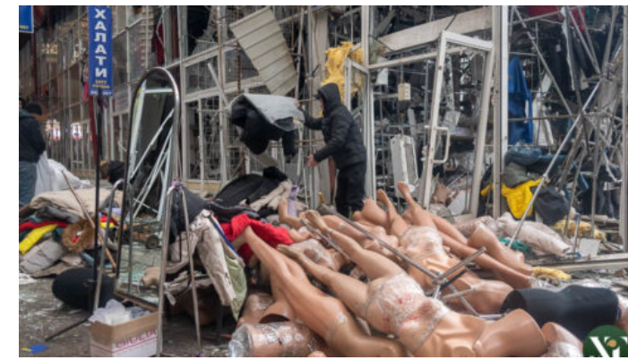
Російський безпілотник вибухнув минулої ночі на території ринку «Барабашово» (фото)

Copyright © Харків Times, 2018-2025. Всі права захищені.