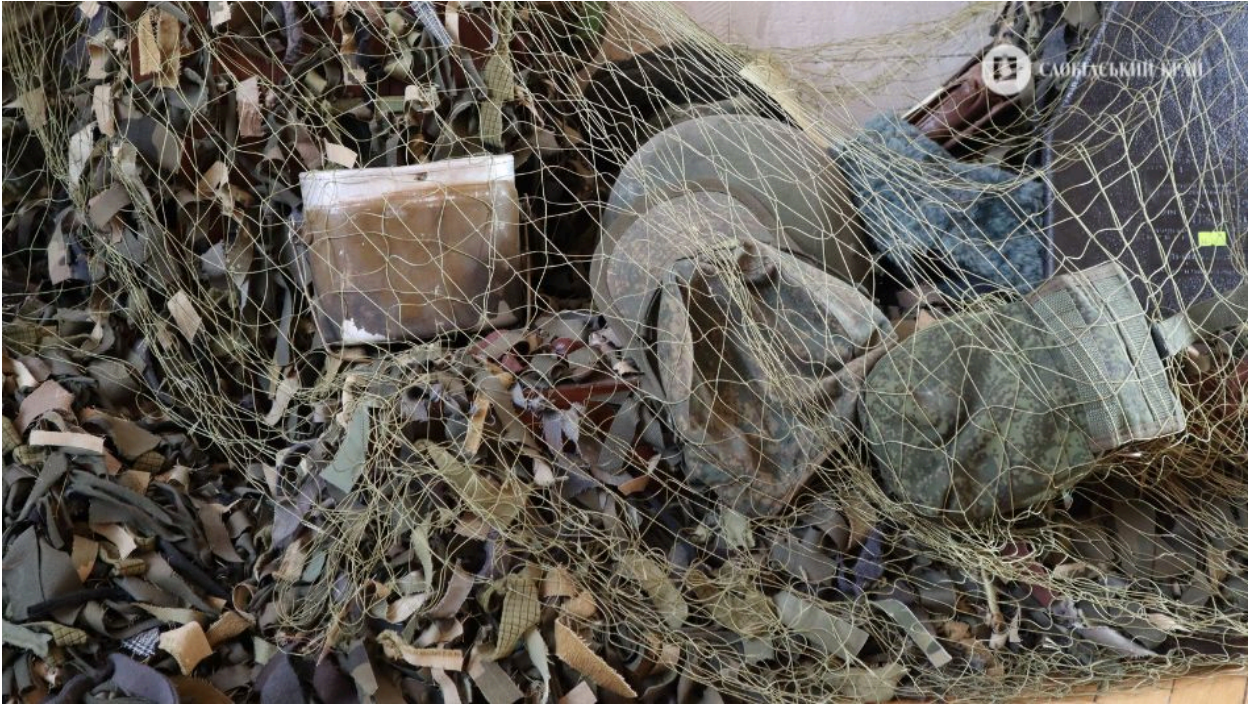
Маскувальні сітки, які виготовляють волонтерки для передової

Попри поважний вік, жінки не планують зупинятися. Вони впевнені: кожен внесок наближає перемогу, а їхня турбота допомагає нашим захисникам триматися в складних умовах.