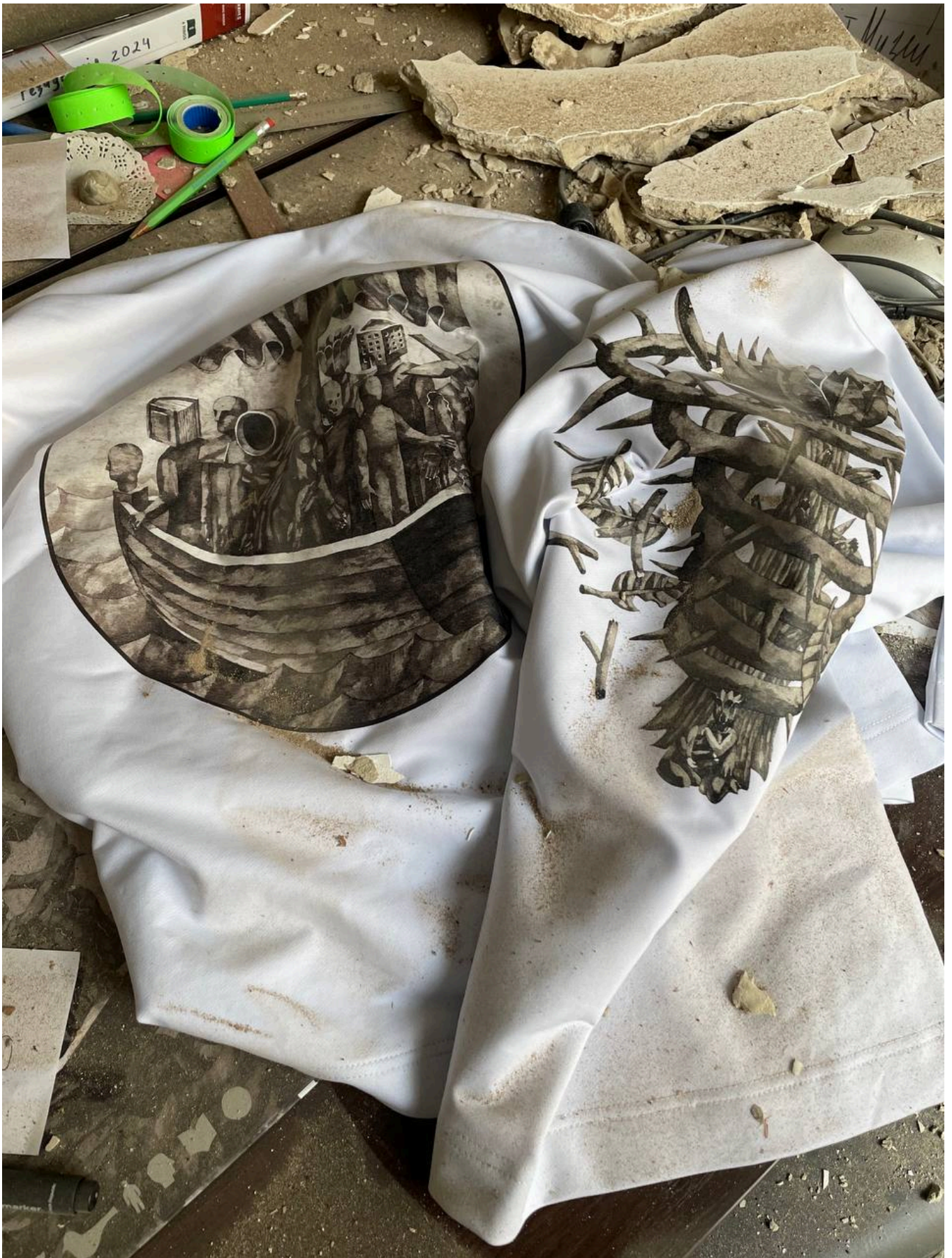
Харківський літмузей після влучання дрона неподалік 1 березня