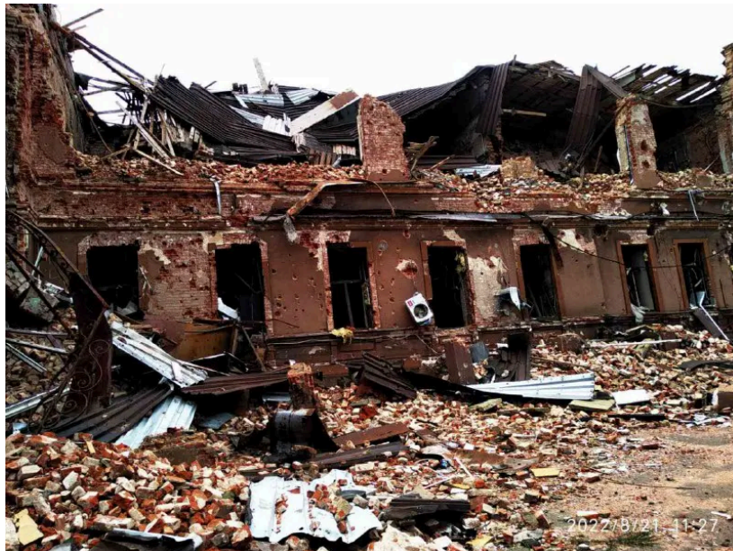
Будівля бібліотеки після бомбардування

На більш свіжих фото бібліотеки я побачила, що руйнувань стало більше, хоча бойових дій в місті вже не було. Виявилось, росіяни знешкоджували нерозірвані снаряди просто на території бібліотеки, нікуди їх не вивозячи.