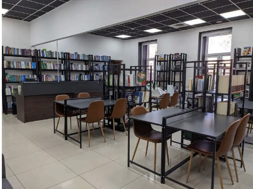
Так Центральна міська бібліотека ім. Короленка виглядала до обстрілів, фото з архіву Вікторії Лісогор

У нас було 97 працівників. Слава богу, всі живі, частина виїхала з Маріуполя. Але у Дніпрі поки що тільки я. Сподіваюсь, якщо справи підуть добре, хтось з колективу долучиться до мене тут. Поки я сама починаю відновлювати й відроджувати бібліотеку.