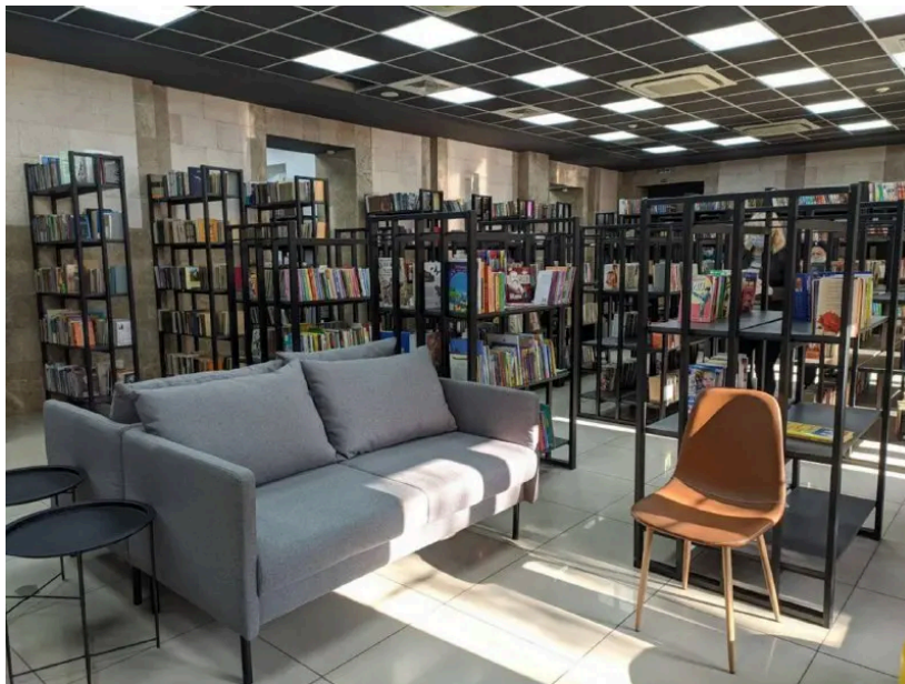
Так Центральна міська бібліотека ім. Короленка виглядала до обстрілів