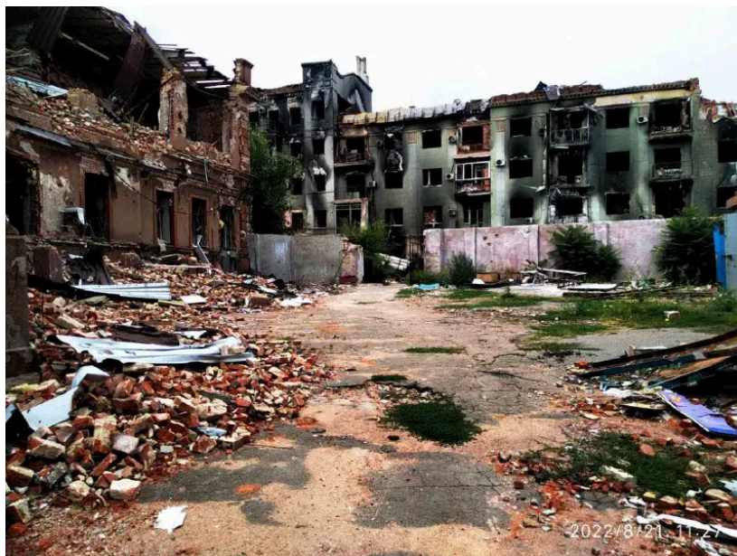
Будівля бібліотеки після бомбардування