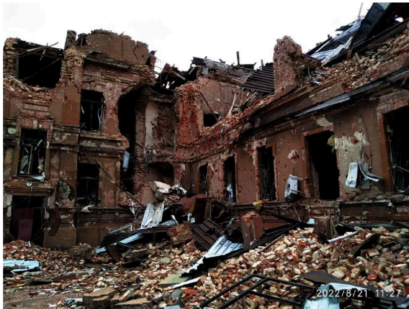
Будівля бібліотеки після бомбардування