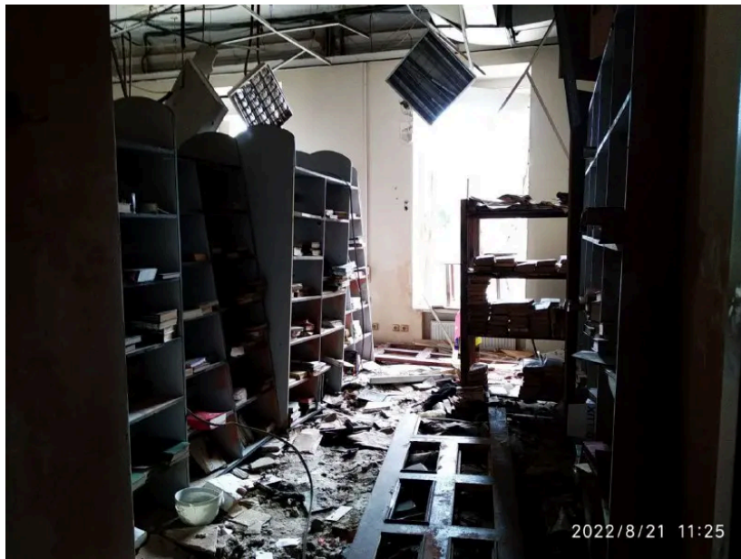
Зала бібліотеки після обстрілів