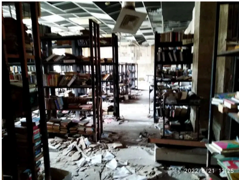
Зала бібліотеки після обстрілів