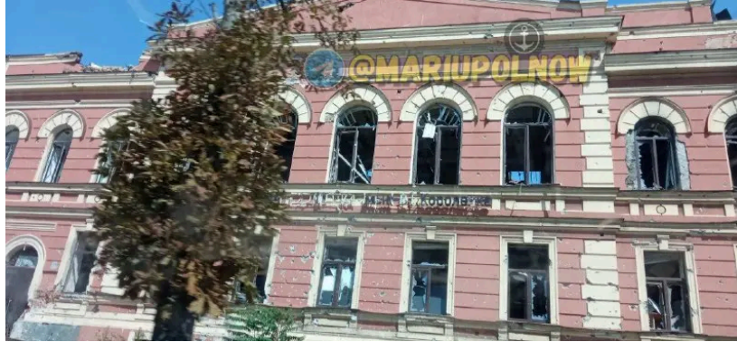
Будівля бібліотеки після перших обстрілів

Під обстрілами ми зі співробітницею рятували старовинні видання. Але їхню долю я не знаю. У нас були старі книжки Шевченка, Гоголя 1805 року... Коли тікали з нашого сховища, 5 пакунків книг ми вивезли в іншу будівлю. Я дівчатам своїм, які залишилися в Маріуполі, сказала: якщо буде можливість, підіть, пошукайте ті книги. Але вони бояться йти туди, бо там зараз якась комендатура.