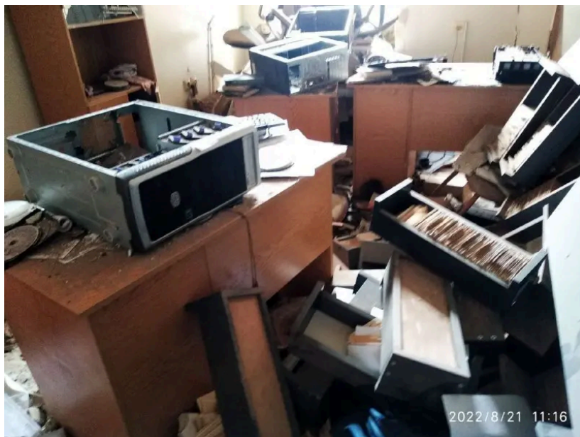
Кабінет бібліотеки після обстрілів, фото з архіву Вікторії Лісогор

Втратили унікальні видання мариупольських літераторів