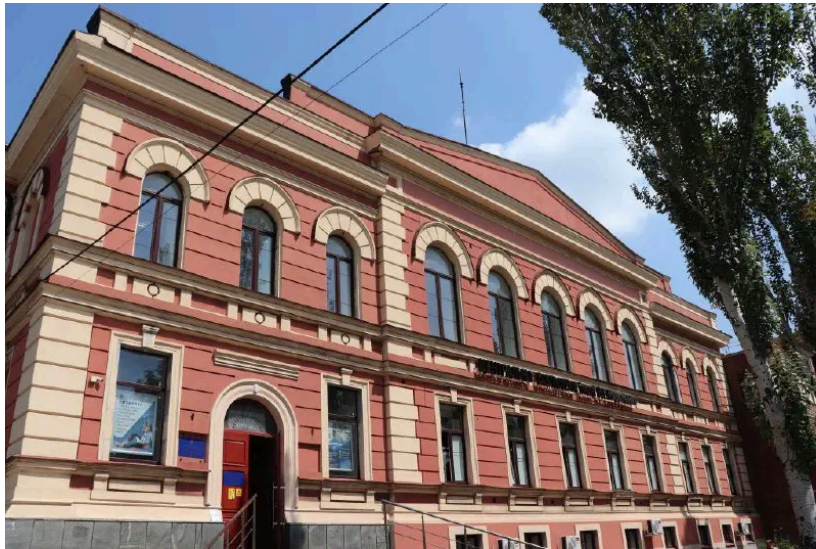
Центральна міська бібліотека ім. Короленка, фото з архіву Вікторії Лісогор