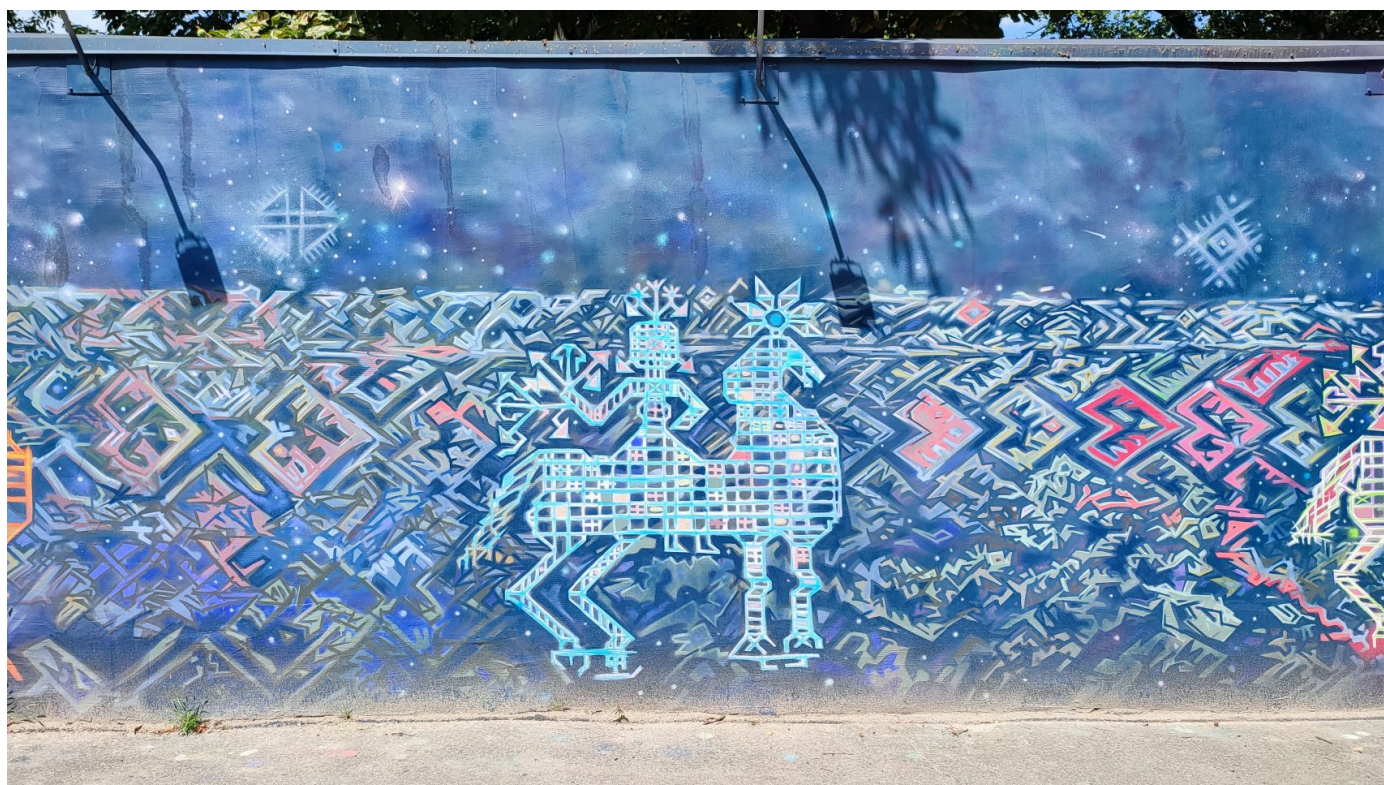
Вершники взяті із орнаменту на українських рушниках. Вони охоронці української культури.