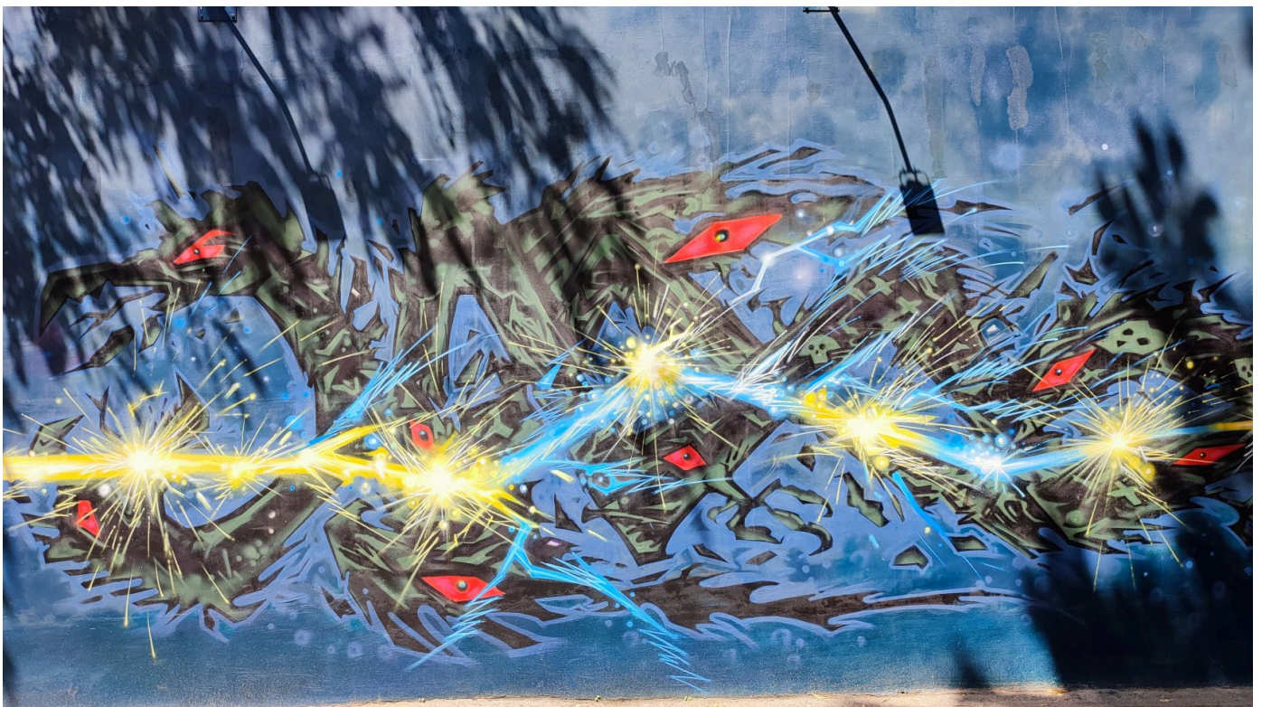
Антигерой: зла потвора, яка уособлює російських окупантів

Кошти на створення муралу — 115 тисяч гривень — вдалося зібрати завдяки небайдужим полтавцям . Пожертви зробили 200 людей. Найменший внесок склав 5 грн, найбільший — 40 тис. грн. Також організатори використали власні ресурси.