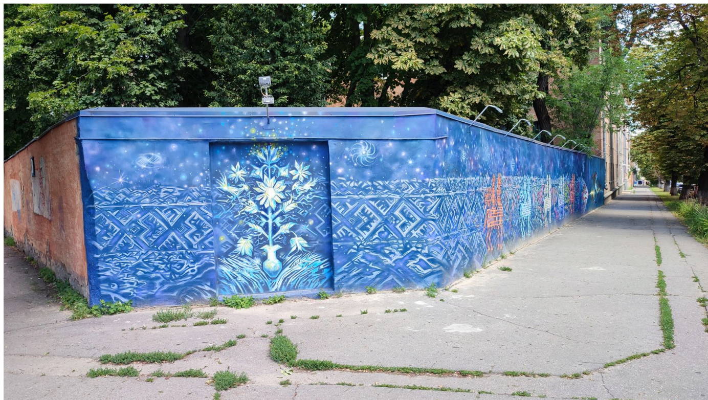
Міфологічні образи і елементи: дерево життя, соняшники, глечик, поле