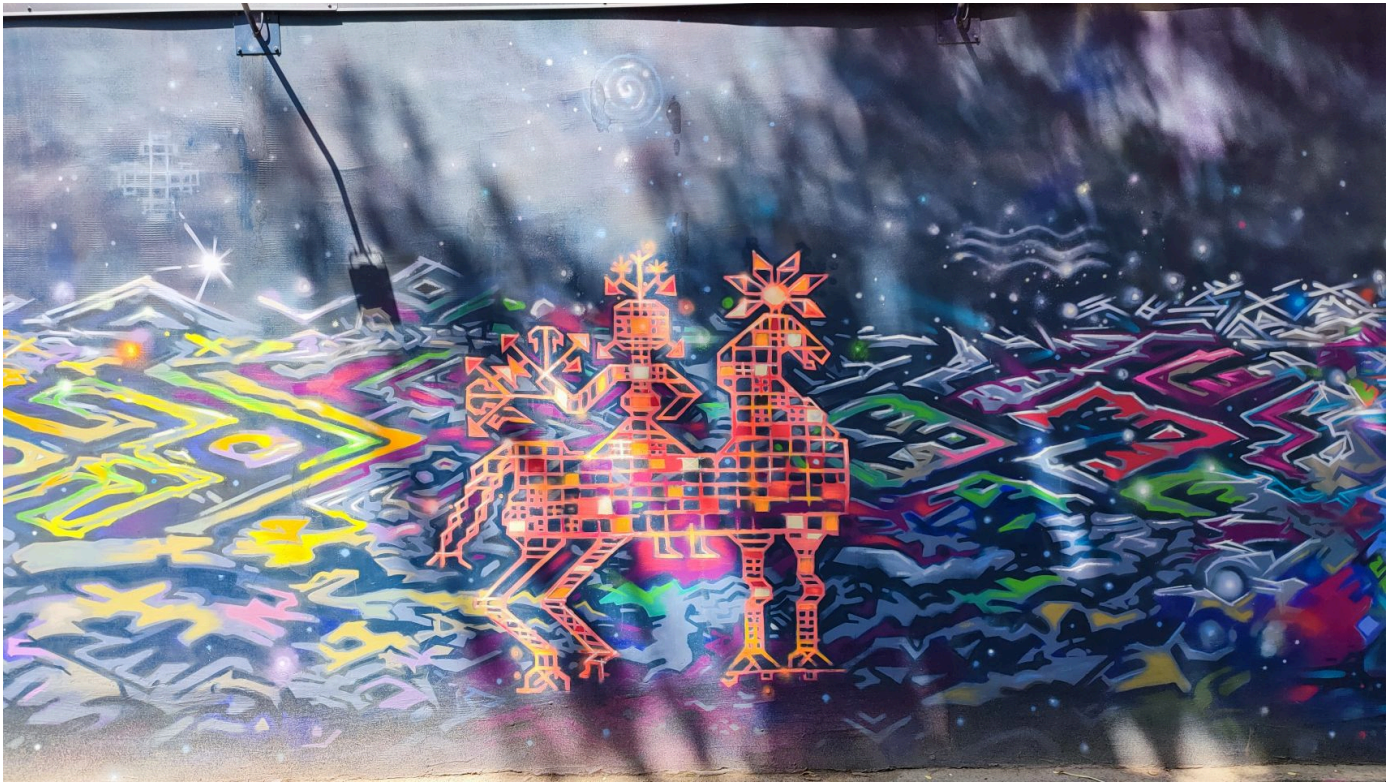
Орнамент називається «орлики». Це центральний елемент композиції. Він видозмінюється протягом всієї композиції, а в кінці стає соколом.