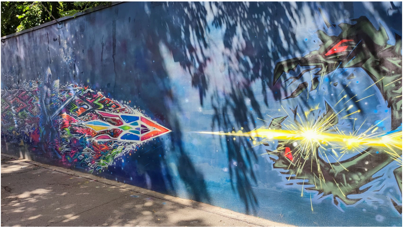
Місце події: космос, паралельне життя