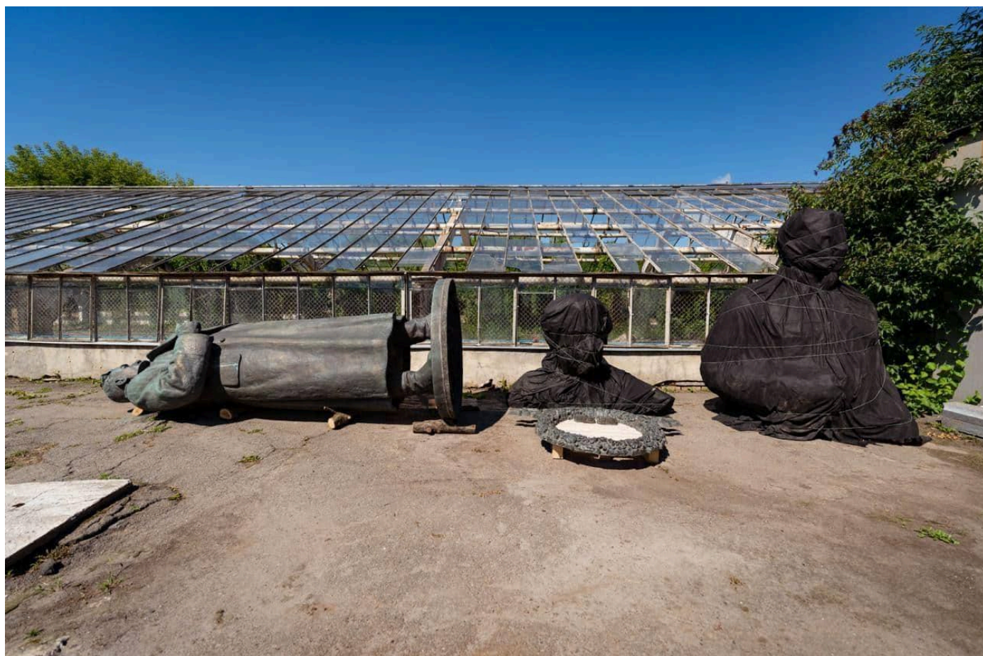
Ватутін і Пушкін дочекалися Зигіна