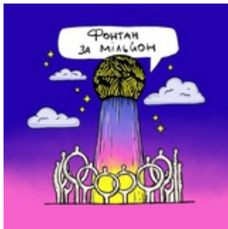
Фонтан за мільйон Полтава