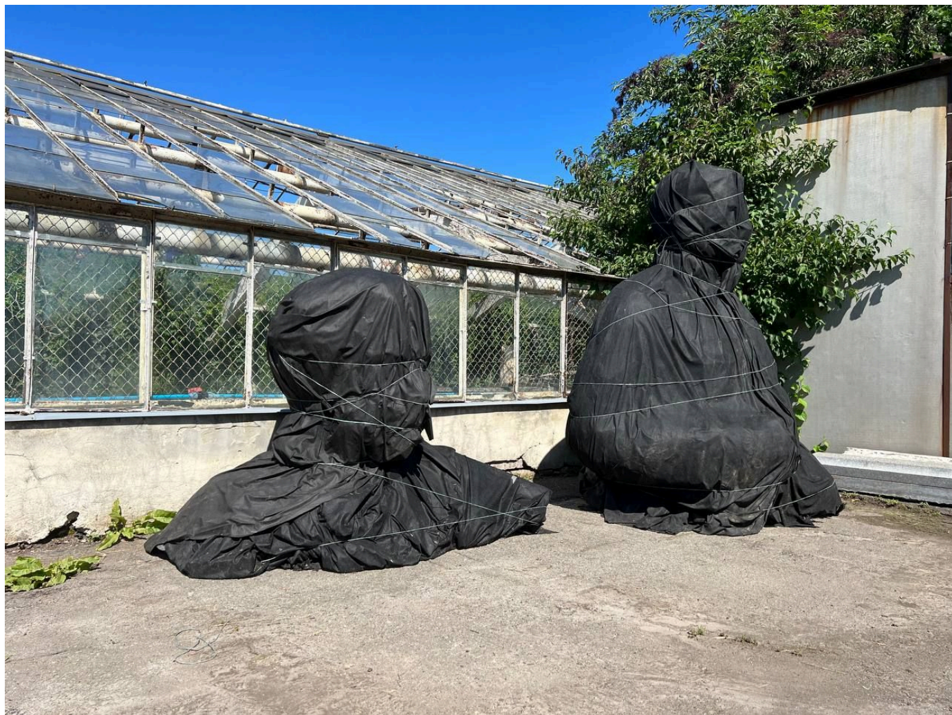
Ватутін і Пушкін чекають на Зигіна