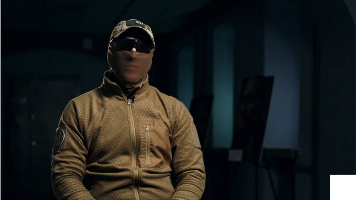
Співробітник контррозвідки СБУ.

затримали, проводять слідчі дії. В СБУ кажуть, що росіяни в більшості випадків шукають для співпраці українських дітей через месенджер Telegram.