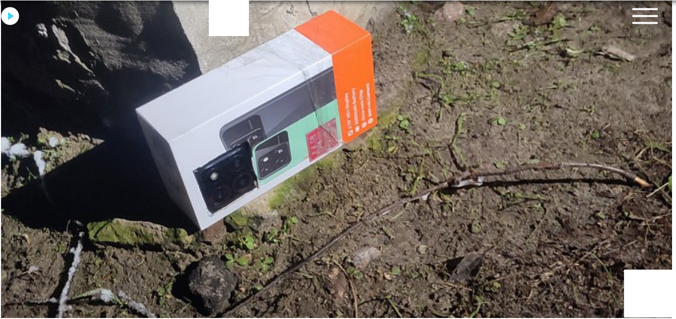
Коробка з телефоном. СБУ

"Вони в онлайн режимі бачили, що відбувається. Вони контролювали, хто заходить, хто виходить з поліції", — розповів співробітник контррозвідки СБУ.