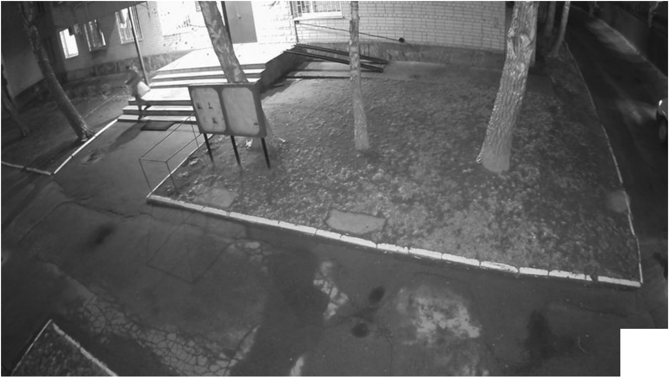
Дівчина виходить з відділка поліції. СБУ

Як розповів співробітник контррозвідки СБУ, коли дівчина зайшла в приміщення, росіяни намагалися дистанційно підірвати її разом з вибухівкою. Коли вибухівка не здетонувала, 15-річна киянка мала покинути приміщення поліції.