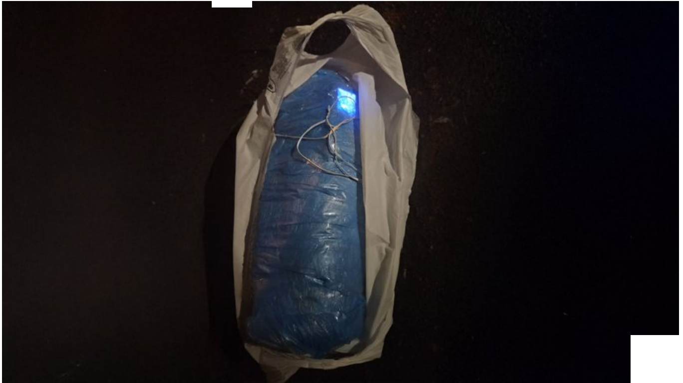
Замаскована вибухівка в пакеті.

"Я забрала, він мені сказав, десь на лавочку пройтися, дістати телефон з пакета. Взагалі там нічого, не чіпати. Була перемотана скотчем коробка. Він сказав, розірвати скотч, включити телефон, подивитися чи включений і покласти назад".