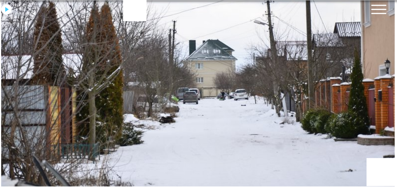
Одна з вулиць в Олександрівці. Суспільне Чернігів

Зараз Олександрівка та Півці розділені між собою старою бетонною дорогою. Сьогодні Олександрівка – це сучасна околиця з приватною забудовою. Тут багато широких асфальтованих вулиць, великих будинків з сонячними панелями, охайних дерев. До повномасштабного російського вторгнення тут зводили багатоквартирний котеджний комплекс.