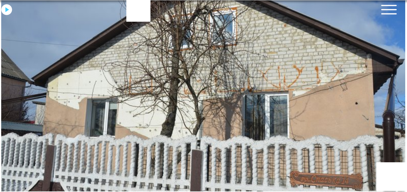
Будинок Марії Лобас постраждав у 2022 році. Суспільне Чернігів

3 січня 2025-го Марія Лобас так само була на кухні, коли почула перший вибух.