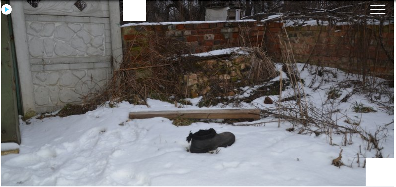
На подвір'ї Олексія Гальонки лежить його взуття.