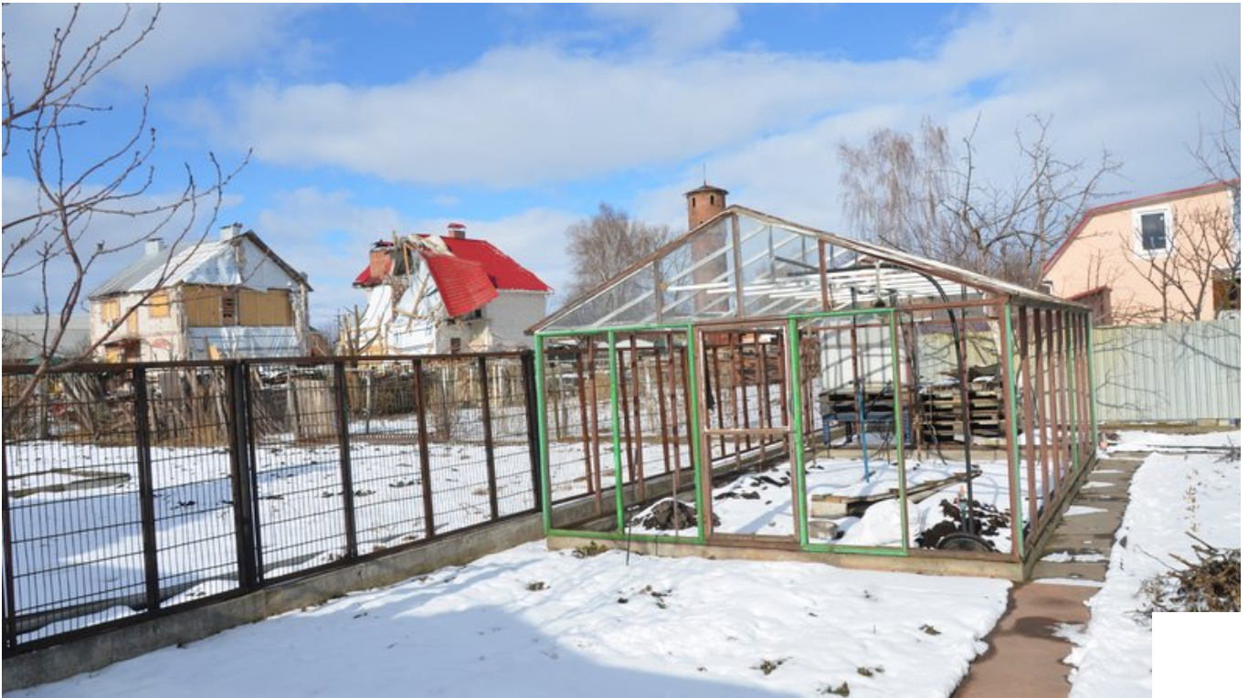
Пошкоджена теплиця та частково зруйновані будинки.