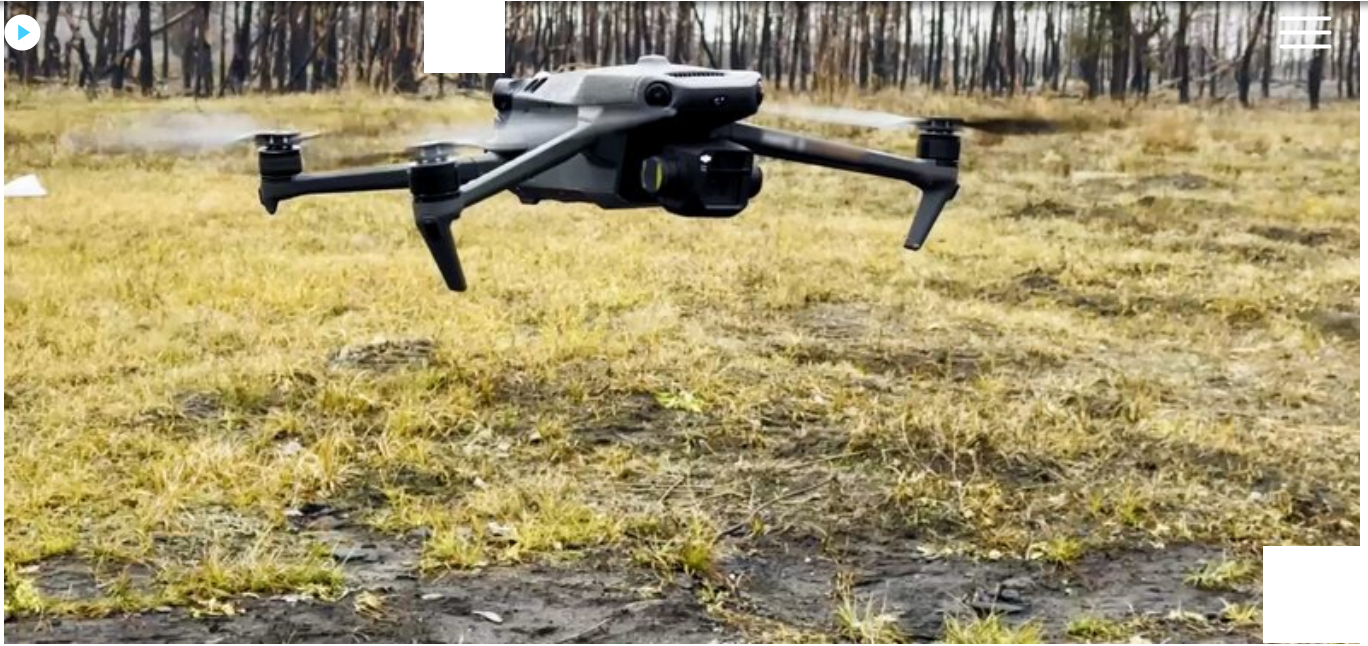
Тренувальний політ FPV-дрона. Суспільне Чернігів

"На навчаннях приїхав до нас капітан. Ми прийшли та записали нас – із 200 людей якраз у список попав".