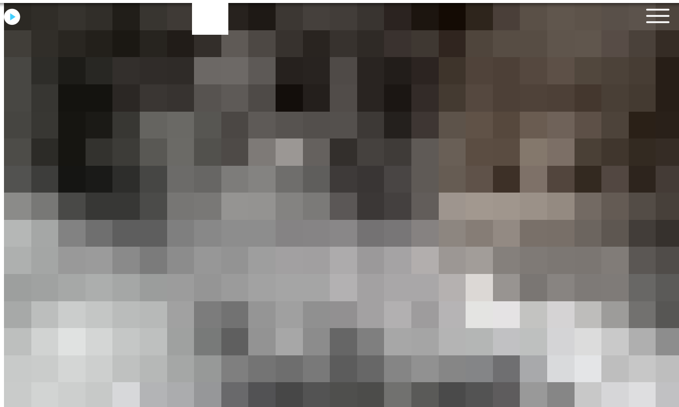
Зруйноване приміщення бібліотеки.

"Наприкінці березня чи на початку квітня, ми не розуміємо яка це було, було пряме влучання. Постраждала тільки бібліотека і квартири поряд. Тобто це було спрямоване знищення бібліотеки. Чи може хтось із колаборантів доповів, що там були хлопці (військові — ред.), але їх там не було, на щастя. Я сподіваюся, що вони живими та неушкодженими добиралися до "Азовсталі" і зараз теж живі", — каже Юлія.