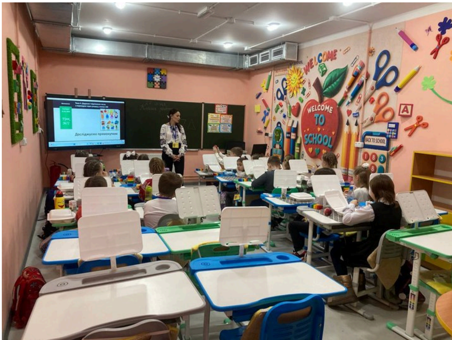
Підземна школа у Новобаварському районі Харкова, 27 січня 2025 року.

місце, де діти почуваються захищеними й щасливими. Водночас є й щемлива правда. Тут вчать діти, які вже закінчують початкову школу, але бачать одне одного наживо вперше. Ковід і війна забрали у них можливість нормального навчання. Тому це і радісно, і сумно... Але найважливіше, що тепер вони разом", — написав мер.