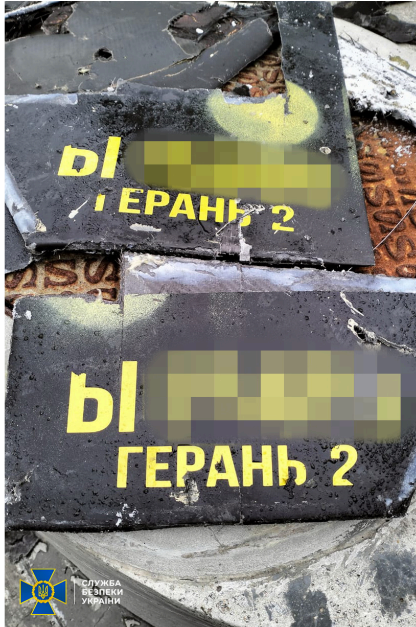
Фото уламків російського безпілотної, який влучив у саркофаг Чорнобильської АЕС, за інформацією СБУ