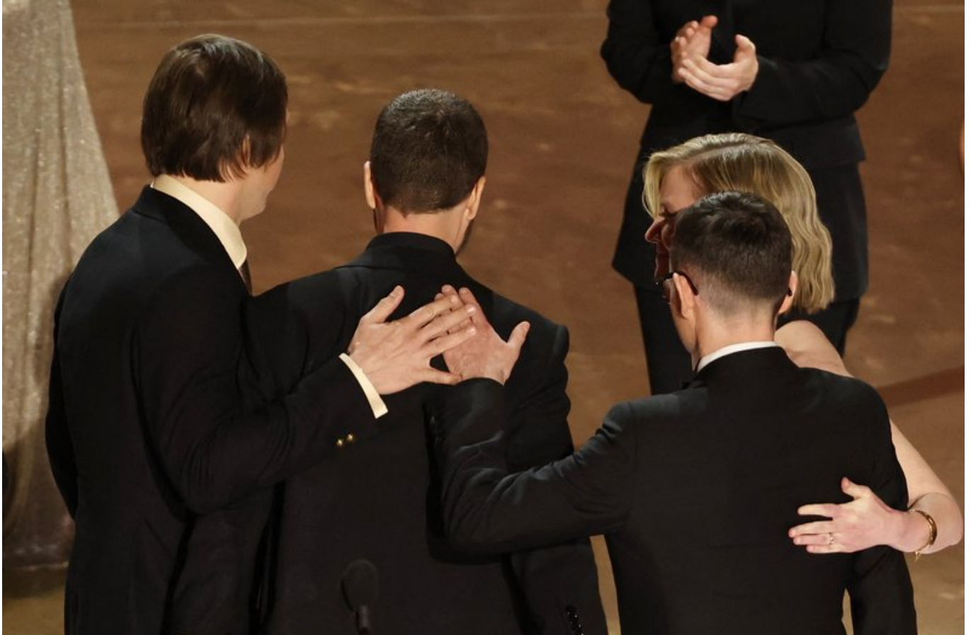
Мстислав Чернов, Євген Малолетка на церемонії премії "Оскар", 10 березня 2024 року.

забули. Тому що кінець формує спогади, спогади формують історію", — сказав Чернов.