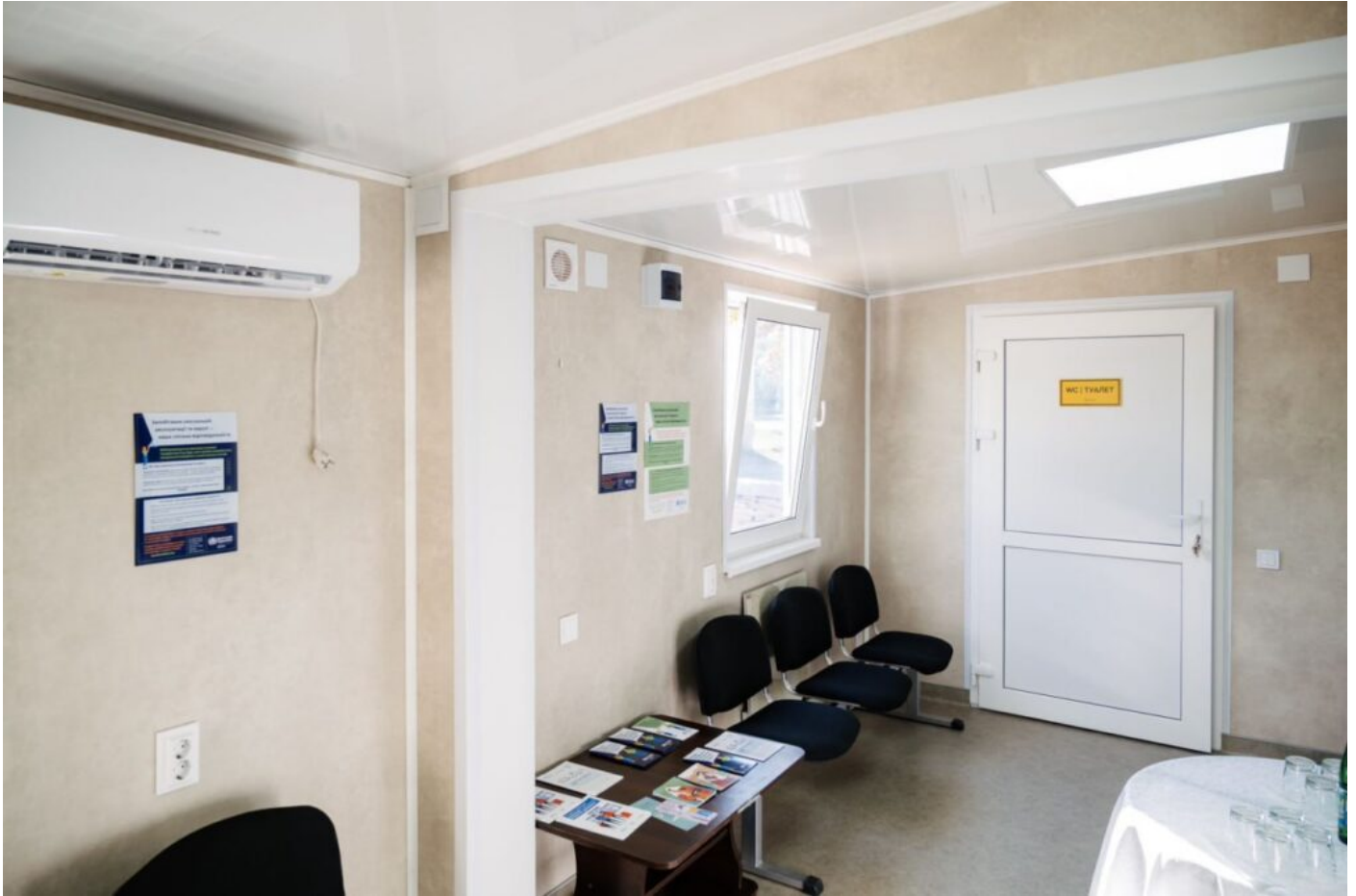
Кімната очікування.

Проект реалізують у співпраці МОЗ та Всесвітньої організації охорони здоров'я. Фінансує ініціативу Європейський Союз.