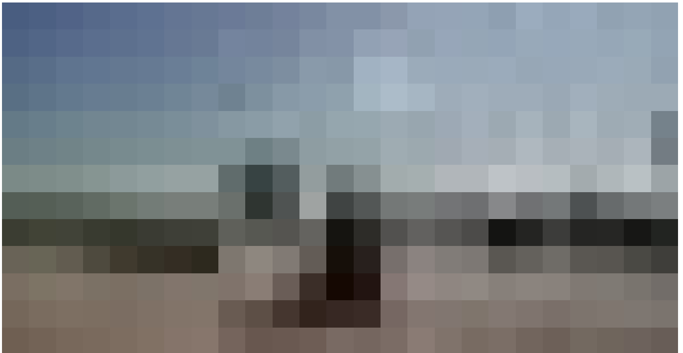
Кадр з фільму "Ми, наші улюбленці та війна".

"Антон перетворив відеоблог про подорожі на репортаж про війну, і ми швидко зрозуміли, наскільки він відданий документуванню життя в Києві", — розповів президент Yар Films Елліот Галперн.