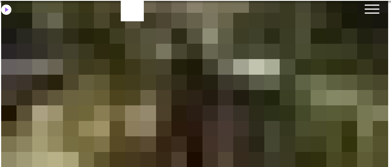
Кадр з фільму "Ми, наші улюбленці та війна".