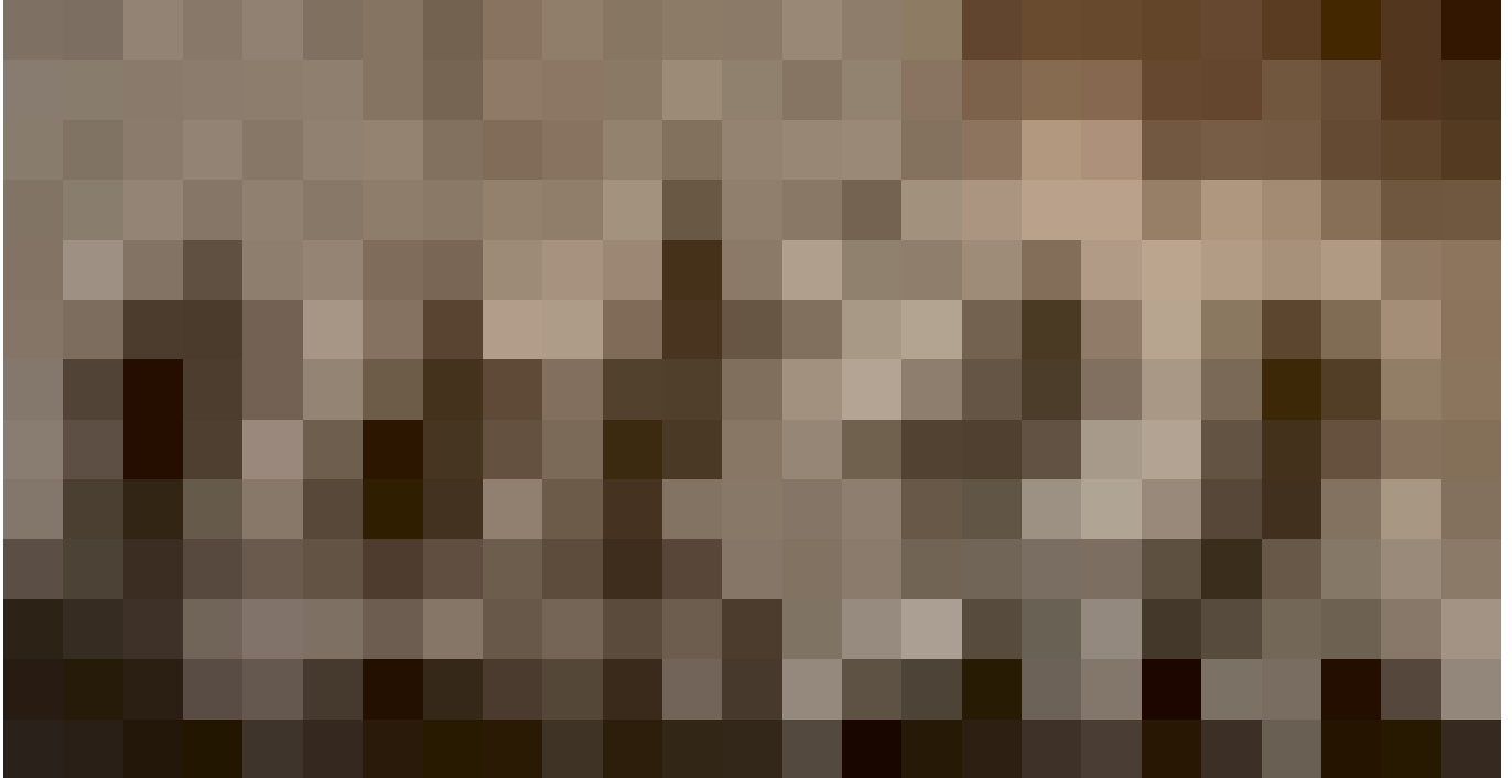
Кадр з фільму "Ми, наші улюбленці та війна".

це питання немає. Це можливо, але глядач має сам зробити цей вибір".