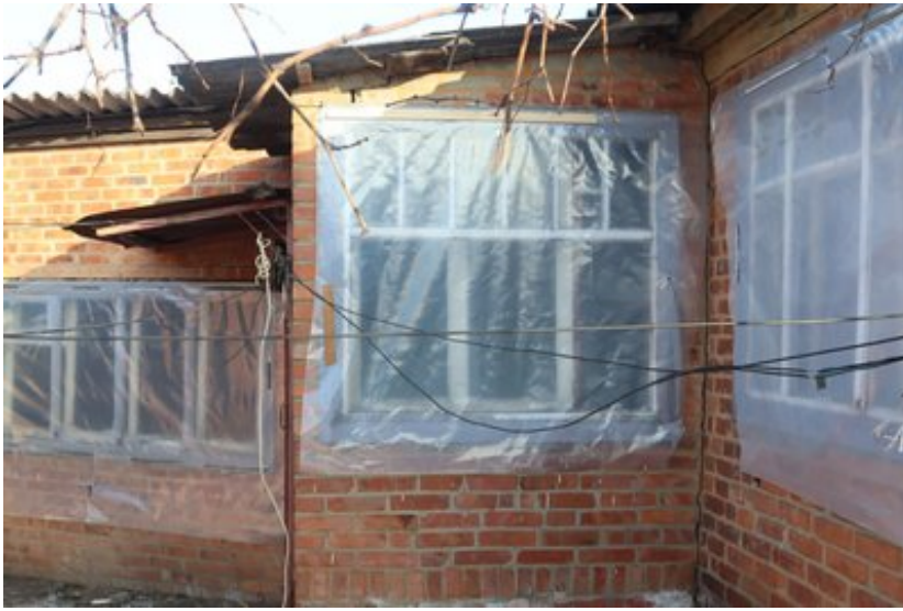
Пошкоджений будинок в Охтирці.