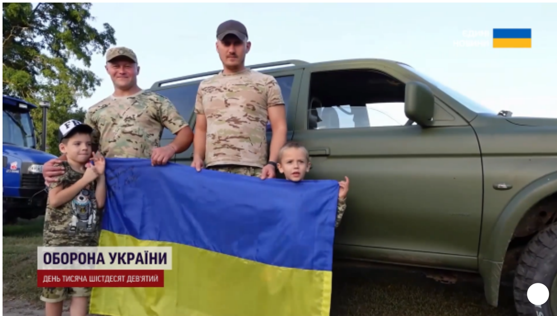
Маленькі волонтери з військовими

Втім усе це не перешкода, аби займатися великими ділами. Адже хлопчик зайнявся волонтерством. За рік на передову вони вже передали понад тисячу дронів та кілька десятків авто. Вони – це блогери Черкащини. Усе починалося з відео про сільське життя – як працювати на землі, садити овочі, робити ковбасу та м'ясо. А потім вони об'єдналися і разом заохочують інших донатити на ЗСУ